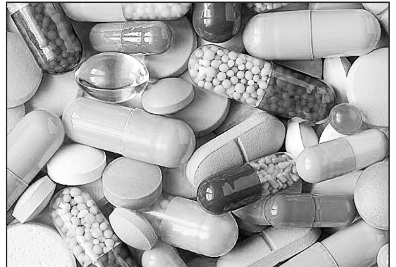
Las multinacionales farmacéuticas hacen de la salud un gran negocio

centrales exigen para la comercialización de los medicamentos.