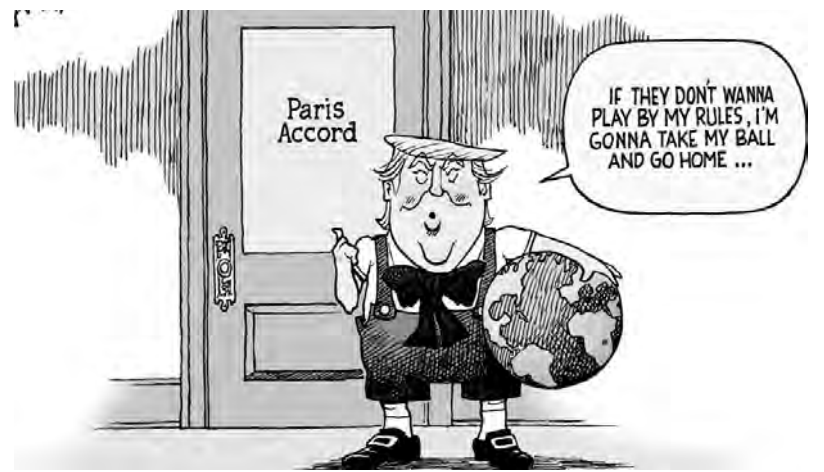
“Si no quieren jugar con mis reglas, agarro la pelota y me voy a casa.” Dibujo de Robert Aerial en el diario estadounidense Kokomo Tribune

Este sistema es el que está llevando a la humanidad al desastre. Hay más de 1.000 millones de habitantes que pasan hambre, cada día a más personas les falta agua potable, centenas de millones respiran aire envenenado o consumen alimentos en malas condiciones. A esto se le suma lo que ya se avizora en el horizonte como una catástrofe ecológica que agravará aún más esta situación. Millones de personas, en particular los jóvenes, se preguntan cuál será su futuro en esta situación y dirigen con toda razón su atención a los problemas ecológicos. En nuestro país hubo y hay grandes luchas contra la minería contaminante y contra el envenenamiento de los fumigantes. Los socialistas, que hacemos nuestras todas y cada una de las reivindicaciones ambientalistas, denunciamos a las multinacionales y a sus gobiernos como responsables. Decimos que no habrá salida mientras no se las expropie. Porque cuidar y no destruir el planeta, nuestra “casa común”, sólo será posible en una sociedad de verdadero socialismo, sin multinacionales. En donde los trabajadores y el pueblo, hoy oprimidos, gobiernen en beneficio de las mayorías.