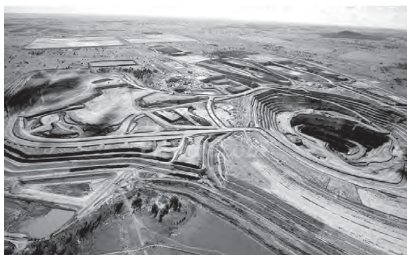
Explotación minera de Barrick Gold en Veladero

La megaminería no sólo representa un fastuoso negocio de miles de millones de dólares sino que además estas ganancias son a costa de la contaminación, la destrucción y el saqueo inescrupuloso de los recursos naturales con la complicidad de los gobiernos de turno. Por eso cada vez que los vecinos se movilizan y cortan rutas o accesos sufren algún tipo de represión, son perseguidos o espionados. Desde Izquierda Socialista somos parte activa de las movilizaciones y brindamos siempre nuestro