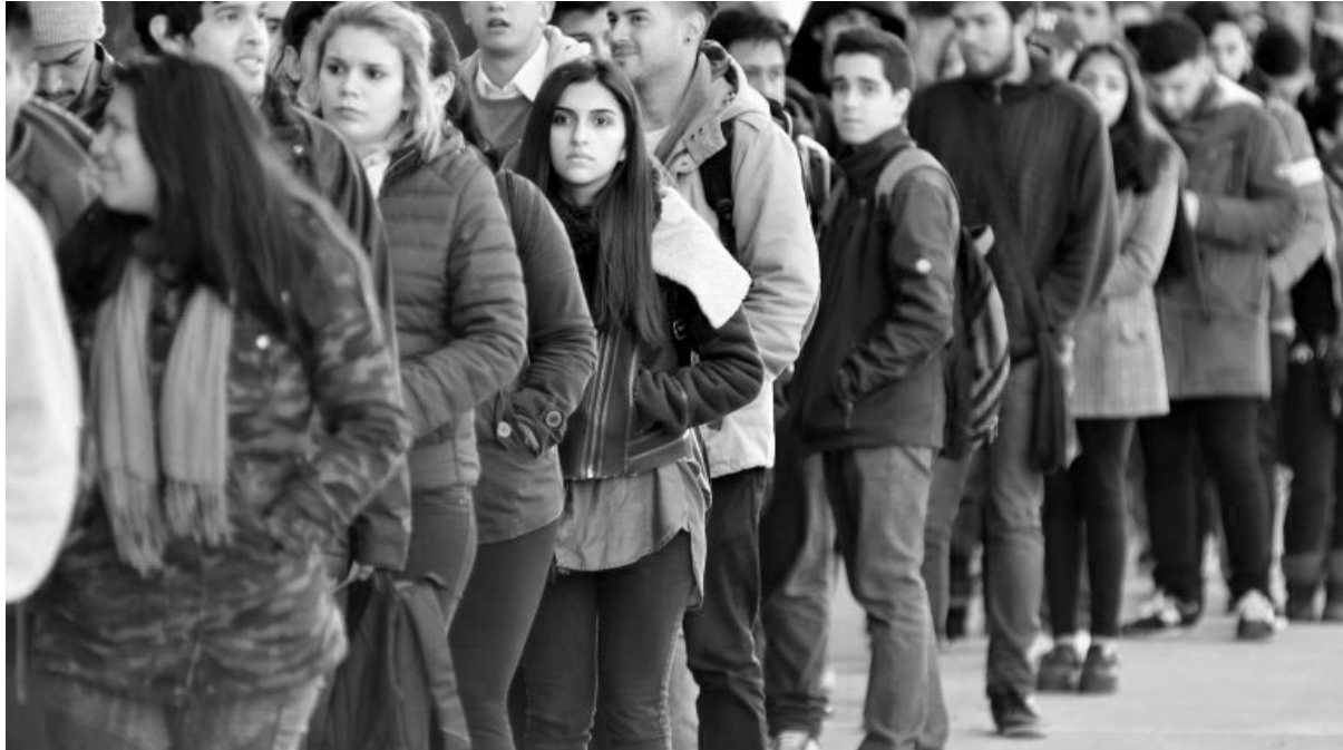
Jóvenes en busca de empleo

La semana pasada el gobierno de la Ciudad de Buenos Aires realizó una nueva edición de la "Expo-Empleo Joven", un lugar donde agencias de empleo temporario y algunas grandes empresas montaban stands de propaganda. Pero esta vez sucedió algo sorprendente: concurrieron más de 170.000 jóvenes, colapsando las instalaciones y haciendo colas de hasta seis horas para entrar. ¿Qué estaba pasando? Simplemente que algunas de estas empresas habían hecho la publicidad engañosa de que ahí se conseguirían "puestos de trabajo". Las anécdotas sobran: pibes y pibas, con sus currículums en la mano, tratando desesperadamente que se los reciban en los diferentes stands, sólo para recibir como respuesta: "no te va a servir para nada, mejor mándalo por internet y te incorporamos a la base de datos". Esta es la primera denuncia que tenemos que hacer: el Gobierno de la Ciudad armó una propaganda marketinera jugando con las necesidades e ilusiones de decenas de miles