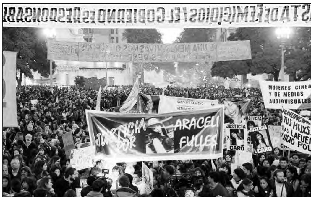
Marcha del #NiUnaMenos en Plaza de Mayo

Dicen que plata no hay, mientras pagan millones de deuda externa y financian a empresas privadas. Y esto no es una mera casualidad. A los gobiernos, tanto al nacional como a los provinciales, todos ellos patronales y patriarcales, las mujeres les servimos oprimidas y hostigadas para garantizar nuestra superexplotación. Por eso, hoy más que nunca resulta fundamental que la bronca de las mujeres en las calles, se traduzca en organización. Las mujeres que venimos construyendo Isadora – Mujeres en lucha, creemos que es necesario unificar nuestras fuerzas para dejar de reclamar justicia frente a los hechos consumados. Por eso queremos decir con todas las letras que el gobierno es responsable. A cada uno de nuestros derechos los arrancaremos con la fuerza de nuestra movilización y organización contra los gobiernos, la justicia patriarcal, la iglesia y todas esas instituciones que son los principales sostenes del machismo.