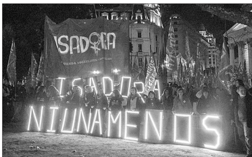
Columna de Isadora ingresando a Plaza de Mayo