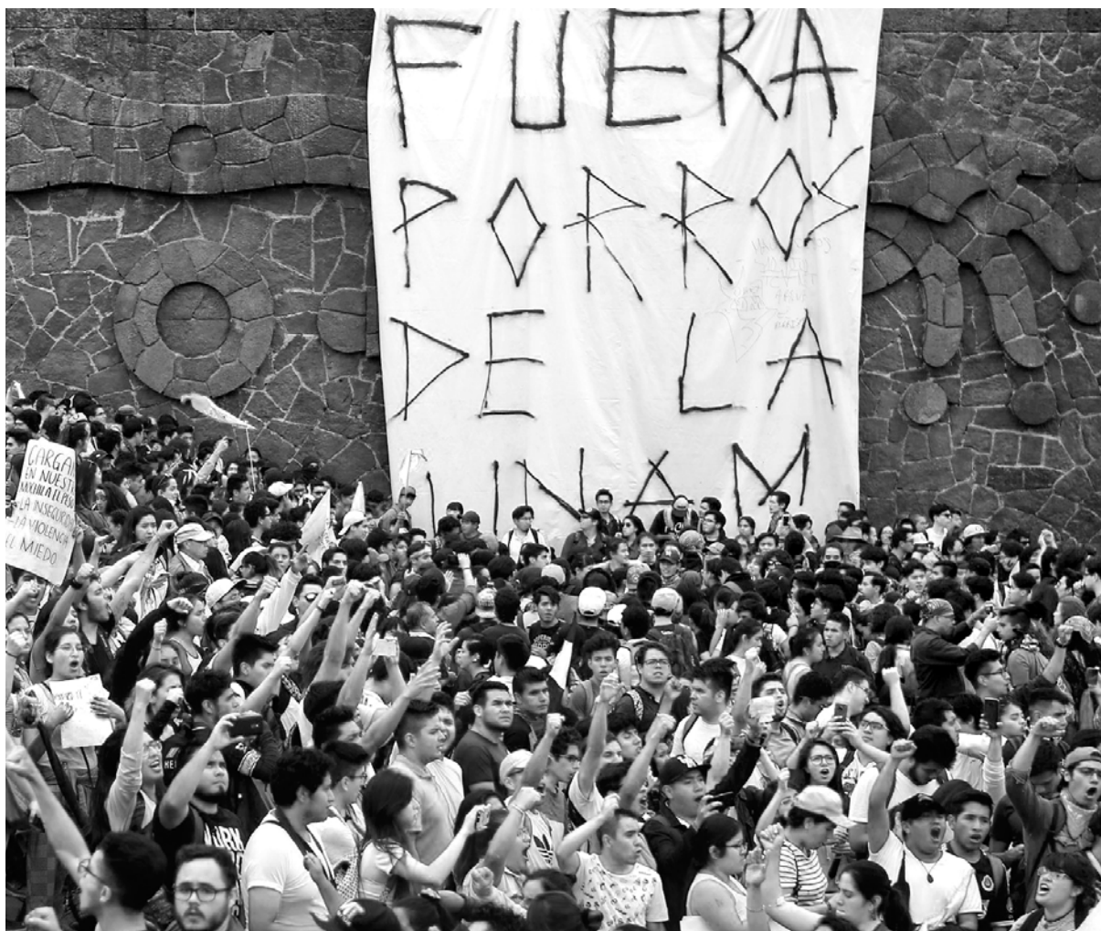
La protesta estudiantil en el campus de la UNAM exigiendo la expulsión de los grupos de choque (“Porros”)