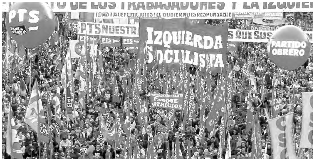
La salida de fondo es luchar por un gobierno de los trabajadores

Propusimos realizar una campaña de agitación nacional del Frente de Izquierda con estas tres consignas centrales: “Abajo el ajuste de Macri, el FMI y los gobernadores”, “No al pago de la deuda externa” y “Paro nacional de 36 horas el 24 y 25 de septiembre y plan de Lucha nacional”. En la carta de Izquierda