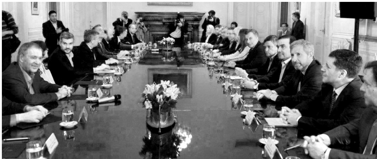
Los gobernadores y Frigerio avalando el presupuesto 2019

El FMI fue clarísimo: exige no sólo el mayor ajuste que el gobierno de Macri le llevó a Washington la semana pasada. También el apoyo explícito de la oposición a dicho plan. Esto se expresa en concreto en un aval que deben otorgar los gobernadores al proyecto de presupuesto 2019 (donde estarán el corazón del recorte de 500.000 millones de pesos) y la garantía de que el peronismo, en sus distintos bloques, le debe “proveer” a Cambiemos del número necesario de diputados y senadores como para que dicho presupuesto se apruebe. Lo concreto es que el peronismo está dispuesto a jugar ese rol.