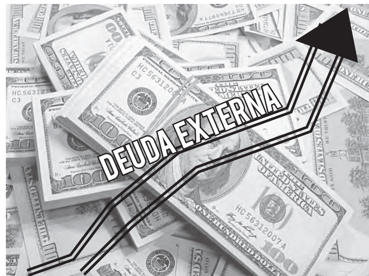
La deuda externa: una bola de nieve que nos lleva al desastre