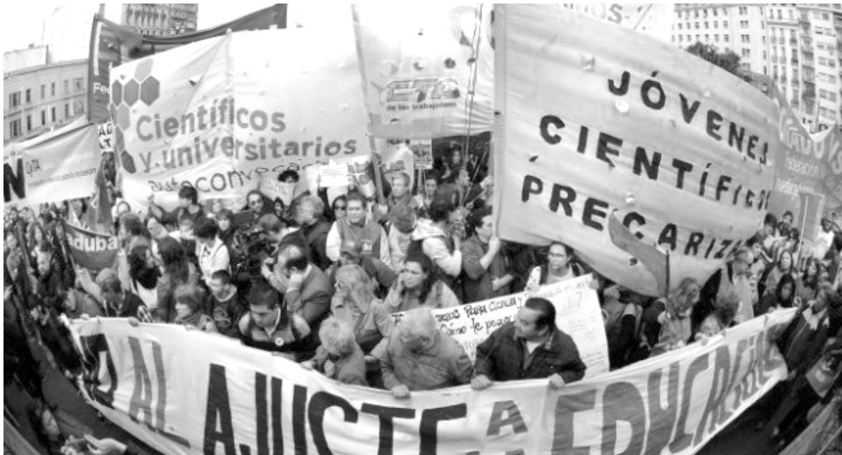
Los docentes universitarios, junto a los estudiantes, protagonizaron multitudinarias marchas contra el ajuste en la educación

La rebelión educativa continúa en todo el país, luego de la masiva movilización del pasado 30 de agosto, donde el conjunto de la comunidad universitaria salió fuertemente a decirle “no” al gobierno y su plan de ajuste. Las tomas en las universidades se multiplican en todo el país, crece la bronca por el ajuste y se siguen desarrollando grandes movilizaciones para ponerle un freno al gobierno. Pero lo cierto es que para Macri y su gabinete está primero el pago de la deuda y el plan de ajuste acordado con el FMI. Además ahora buscan pactar con los gobernadores