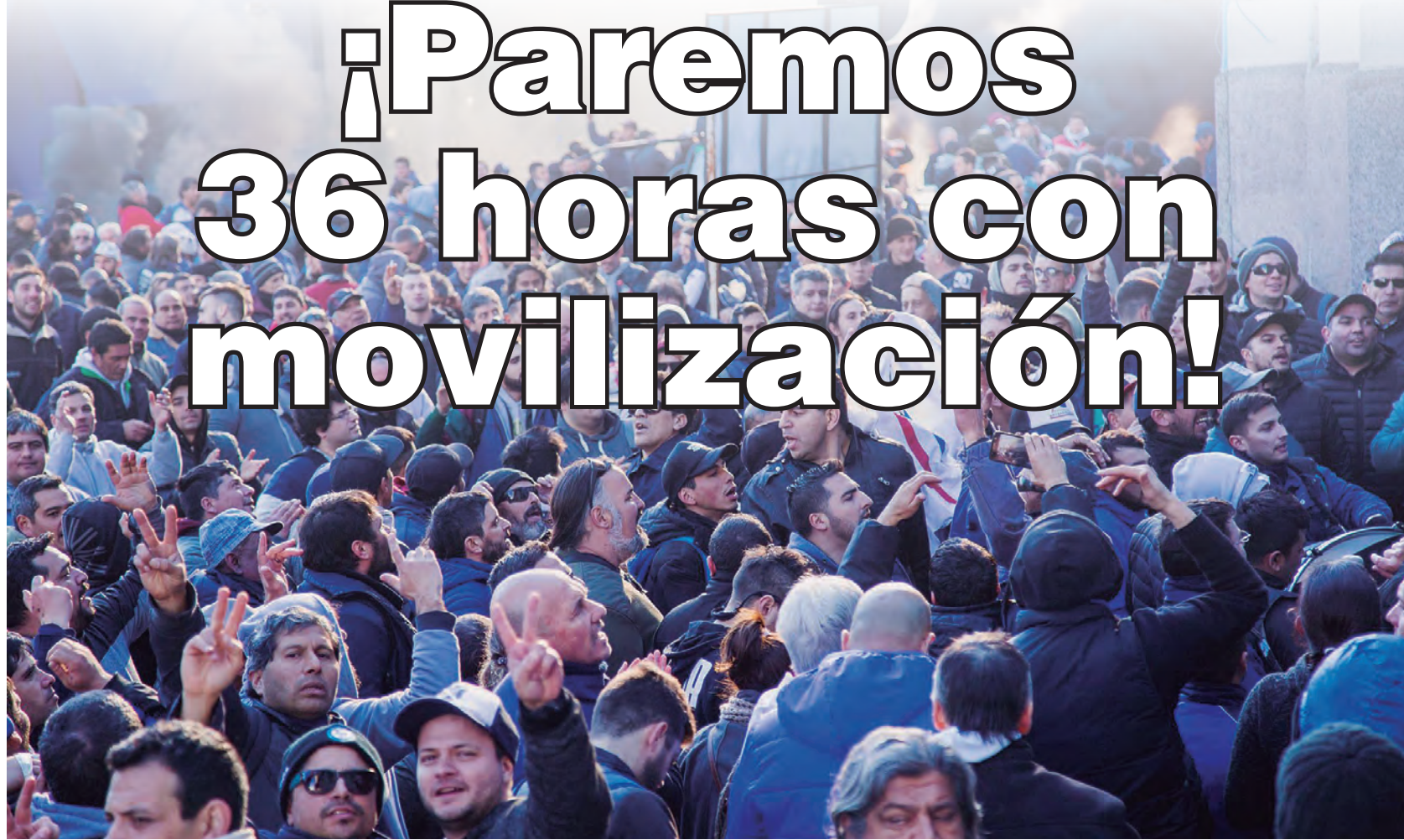
Crece la bronca y la movilización contra las políticas de hambre del gobierno y el FMI

La devaluación es una brutal pérdida de salarios y jubilaciones. El aumento del dólar del 100% en lo que va del año ya se fue trasla-