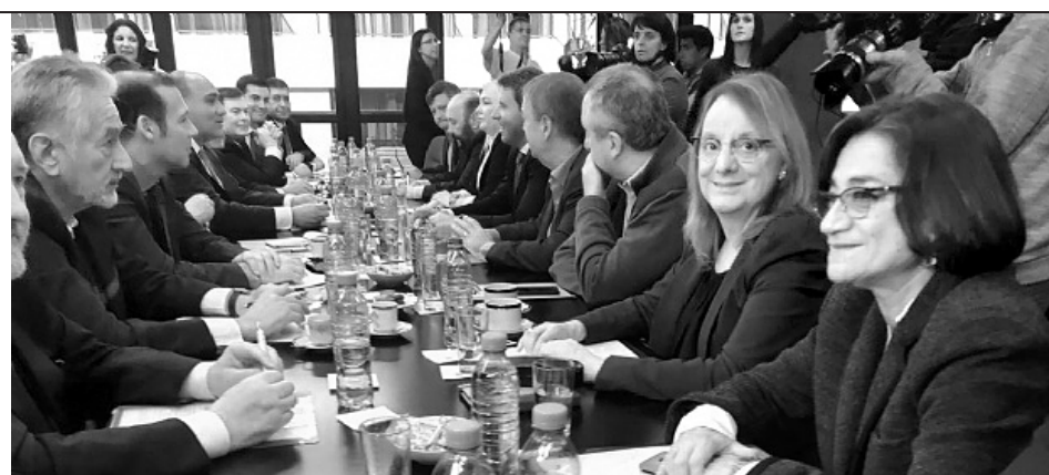
Alicia Kirchner en la reunión de los gobernadores con el gobierno

Las principales figuras del kirchnerismo insisten en repudiar de palabra el acuerdo con el FMI y el ajuste que implementa el gobierno con apoyo de los gobernadores. Por ejemplo, Cristina declaró: “La catástrofe financiera y cambiaría adquiere ribetes de tragedia cuando Mauricio Macri y la Alianza Cambiemos, le comunican a los argentinos y argentinas que han decidido volver al FMI a pedir préstamos”. Incluso el kirchnerismo organizó un gran acto “en defensa de la patria” el 9 de julio, con centro en el repudio al pacto con el Fondo, al que declararon “ilegal”. Pero a la hora de las soluciones todo confluye en el llamado a votar por el kirchnerismo en el 2019. Y, en nombre de la “institucionalidad”, en garantizarle todo lo necesario al macrismo para que transite con la mayor tranquilidad