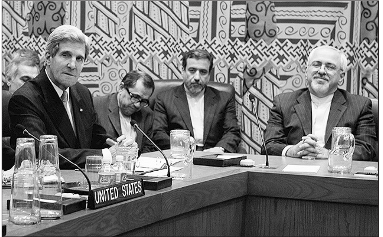
El Secretario de Estado de EE.UU., John Kerry, negociando con el canciller y otros funcionarios de Irán. Cristina Kirchner cambió al compás del giro político norteamericano.

de 2013 que se proponía con Irán, vía el llamado memorando. El gobierno lo fundamentaba como una “búsqueda de la verdad” y porque “evitaría” nuevos atentados. El gobierno ubicaba ese giro como “antiimperialista” y hoy así se quieren mostrar para contrarrestar la acusación de Nisman. Pero nunca hubo una postura antiimperialista. Porque en realidad el que hizo el giro hacia negociar con Irán fueron Obama y los EE.UU., desde que fueron abandonando la postura del “garrote” de Bush para buscar llegar a un acuerdo. Es esta política la que está en curso aunque cuenta