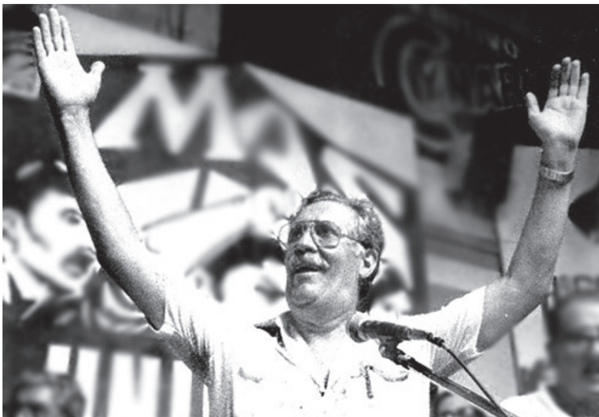
Moreno en el congreso mundial de 1985, Argentina

La cabeza abierta a los procesos nuevos no le impedía, sin embargo, sostener al mismo tiempo una posición crítica e independiente hacia el castro guevarismo. Así, desde un primer momento advertía sobre los peligros que suponía la propuesta del Che, de extender la guerra de guerrillas a todo el continente. Moreno le discute que es necesario distinguir entre lucha armada y la táctica de guerra de guerrillas. La generalización simplista del foco guerrillero de Guevara a toda Latinoamérica conducía al desconocimiento de la realidad, de las formas de lucha y organización de cada movimiento de masas y llevaba a enfrentamientos difíciles y a la muerte a valientes jóvenes que a comienzo de los sesenta impulsaron los focos guerrilleros