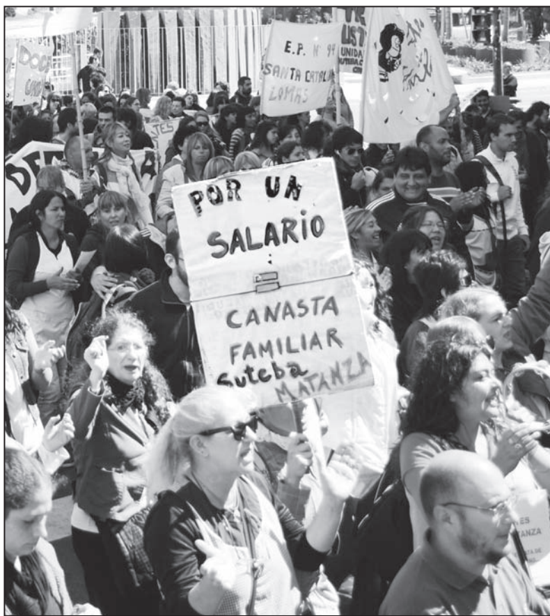
Hace falta un plan de lucha nacional

Ante esto, los dirigentes sindicales -tanto oficialistas como opositores- le han dejado las manos libres a los gobiernos (el nacional, provinciales y municipales) para que sigan con el ajuste. También a las patronales. Dejando librados a su suerte a los sectores de trabajadores que salieron a dar la pelea. Algunos gremios acordaron algunas migajas a cuenta de las paritarias.