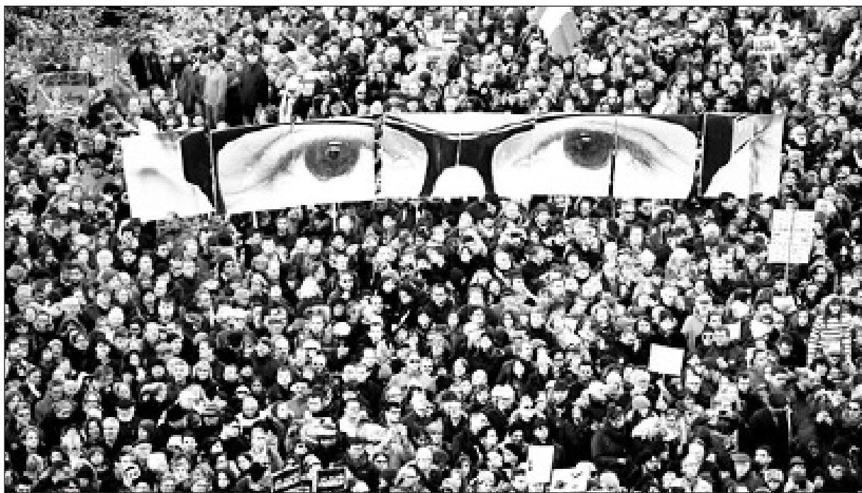
Desde nuestro partido repudiamos el ataque criminal y alertamos sobre el uso del hecho por los políticos imperialista para lavarse la cara por sus políticas de ajuste y represión

El imperialismo francés, como el europeo en general y el yanqui, han mantenido una política genocida contra los pueblos, asesinando a millones de argelinos, vietnamitas, iraquíes, afganos y palestinos. Ellos mantienen una política racista contra el pueblo palestino y también