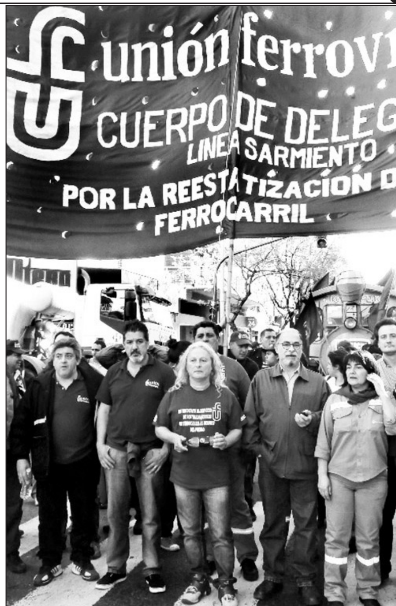
Los delegados del Sarmiento en lucha contra las mentiras y los ataques de Randazzo

El ataque lo analizamos en dos planos. El primero es que se da en el marco de la campaña de Randazzo para las elecciones. Y el segundo, que es dirigido a un cuerpo de delegados que no tranza. Por eso dicen cualquier barbaridad para desprestigiarnos. Randazzo le está diciendo a la patronal que él va a disciplinar a quienes no responden a la burocracia sindical. Es un mensaje a la patronal, como parte de su campaña electoral, les dice: “Yo a éstos los voy a barrer”. No está atacando a tal o cual trabajador, aunque elija a un par de trabajadores puntuales. Hace esto para decir que el supuesto sabotaje está promovido por