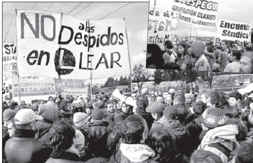
Los despedidos de Lear siguen reclamando. Arriba, jornada de protesta exigiendo el reingreso frente a la planta, lunes 19 de enero

Es una vergüenza que un gobierno que se dice nacional y popular y que con frecuencia declama por la “democratización de la justicia”, no haga cumplir los fallos judiciales favorables a los trabajadores. No se puede decir que el gobierno no sabía que el lunes debían tomar