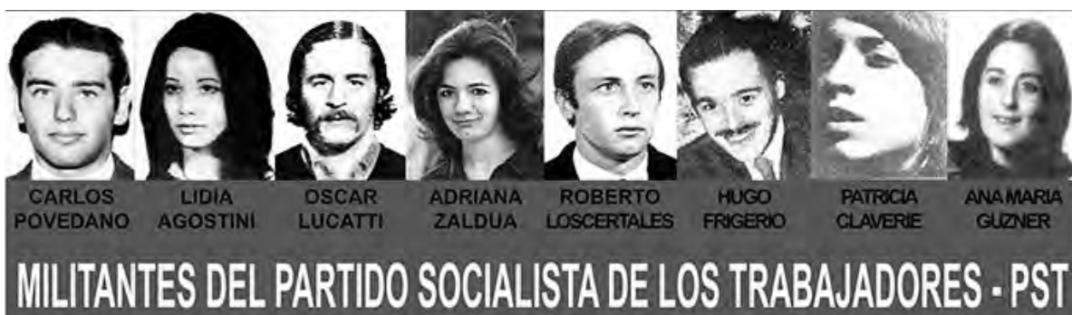
Imagen de los ocho compañeros reproducida del afiche de la Comisión convocante al acto