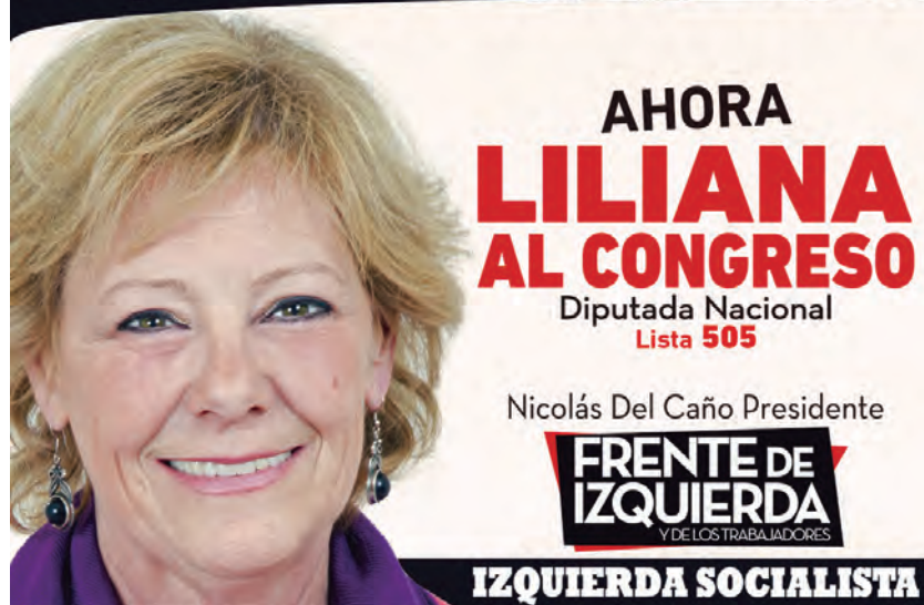
Afiche de campaña de nuestro partido en Córdoba