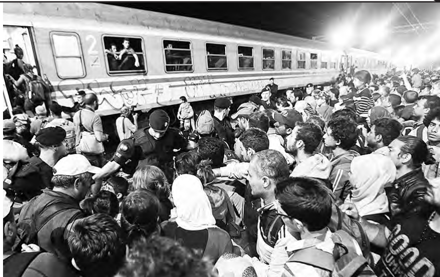
Refugiados tratando de subir al tren en Budapest

(*) Ver Declaración de Estambul en www.uit-ci.org