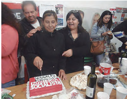
Lomas de Zamora