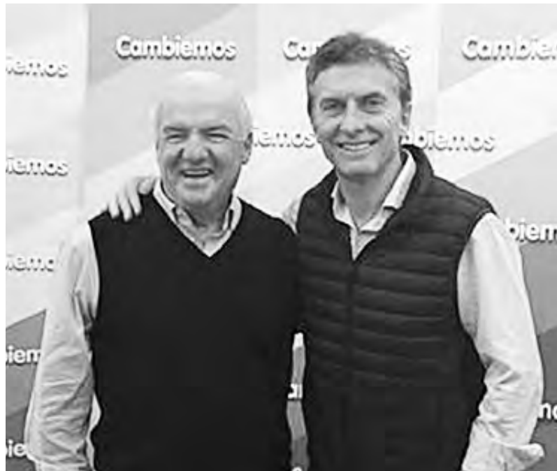
Niembro renunció, pero sigue la impunidad para quienes hacen negocios con el poder

Estas denuncias habrían hecho saltar algo silenciado hasta hoy por el gobierno nacional: la mayoría de las contrataciones de Ciudad se estarían haciendo sin licitaciones previas. Vale señalar que gran parte de las empresas que se benefician de este tipo de contratos no proveen el servicio, no tienen empleados a su cargo sino que, a su turno, subcontratan otras empresas, con menos contactos políticos, cuyo personal suele ser el eslabón más débil de la cadena de precarización laboral. Es el caso de las empresas que reciben los contratos para arreglos de escuelas, hospitales, construcción de edificios públicos, arreglos de calles. La