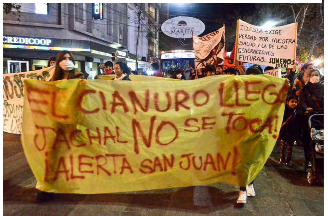
Marcha en San Juan y asamblea en Jáchal

Hoy la única esperanza para nuestro pueblo es seguir en la lucha, movilizado y organizado. Este próximo viernes 25, la Asamblea “Jáchal no se toca” se movilizará con toda la población a la ciudad de San Juan, donde los esperaremos para reclamar: ¡Fuera Barrick de San Juan!