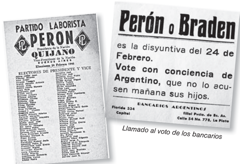
La boleta del Partido Laborista