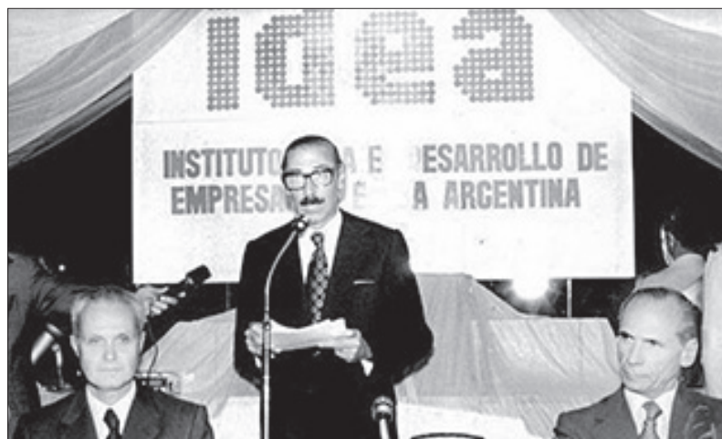
Videla con los empresarios

Estos pulpos conseguían financiamiento internacional con avales de la dictadura y de las empresas públicas (como YPF, que ponían su patrimonio como “garantía”), luego lo hacían crecer internamente a través de los bancos locales de su propiedad (por medio de lo que se conoció como la bicicleta financiera) y finalmente, en 1982, le “encajaron” sus deudas al estado. Esto último, uno de los hechos más aberrantes de la historia económica argentina, fue llevado adelante por Domingo Cavallo, entonces Presidente del Banco Central. Se lo conoció como la “estatización de la deuda privada”