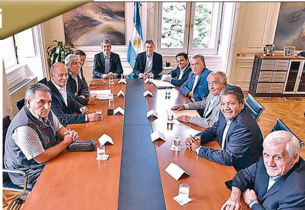
Reunión de las CGT con Macri

De la reunión trascendió que tanto el gobierno como los dirigentes se pusieron de acuerdo en “pedir aumentos por sector”. Es decir, “descuartizar” al movimiento obrero por sindicato. ¿Fueron a una reunión como centrales sindicales y en representación del “movimiento obrero” a decir que van a arreglar cada uno por separado? Una locura.