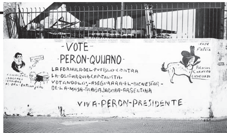
Paredón con las pintadas de tiza y carbón

“Que la clase trabajadora argentina en este movimiento siente como suyos los anhelos e ideales de los trabajadores del mundo luchando al igual que ellos por una mayor justicia social y una mejor distribución de la riqueza, dentro de una auténtica democracia y en un clima de absoluta libertad.”