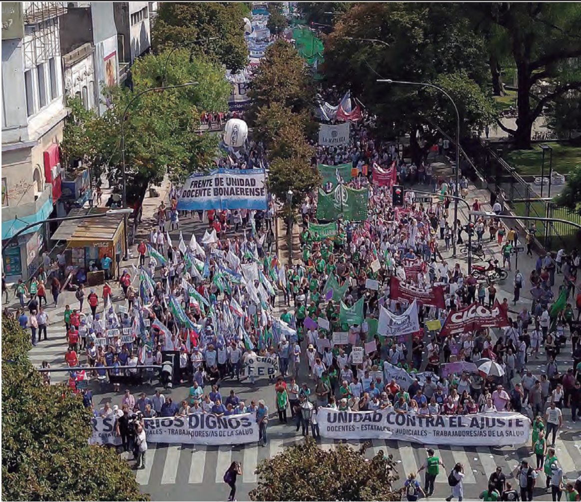
Multitudinaria marcha a La Plata de estatales, judiciales, docentes, médicos de la Cicop y otros trabajadores en lucha

Como se ve, ganas de salir a pelear es lo que sobra. ¿Por qué entonces en muchos gremios ya se ha firmado por el 15%, en cuotas y sin cláusula gatillo, como pide el gobierno? La respuesta es contundente: se debe a la traición