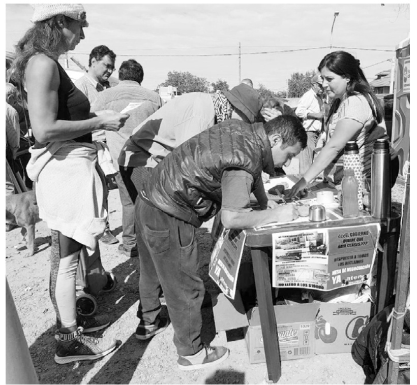
La población apoyó con sus firmas la defensa de la educación pública

Desde la directiva de la Seccional ATEN Capital, venimos