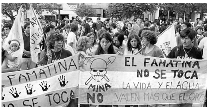
Movilización contra el saqueo de nuestros recursos naturales