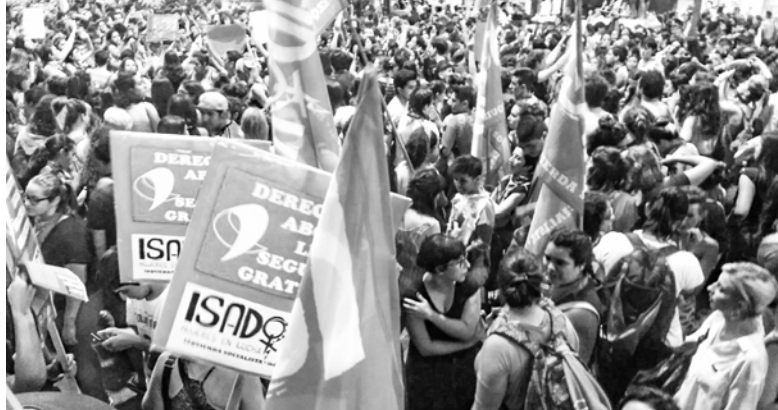
Durante el Pañuelazo en el Congreso 400 actrices presentaron una carta abierta apoyando la campaña nacional