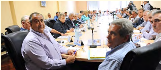
Los burócratas, en camino de construir una CGT oficialista