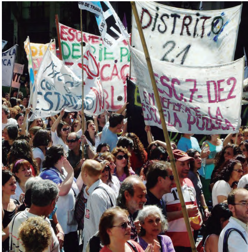
Los docentes siguen la pelea contra el ajuste de Vidal

Desde el sindicalismo combativo tenemos claridad de cuáles son las tareas de la hora. Empezar a organizarnos desde abajo, apoyar las luchas en curso y su coordinación para darles más fuerza y que puedan ganar. Y, al mismo tiempo, sigamos exigiéndole a todos aquellos que se pronuncian contra el ajuste de Macri, a los Moyano, a la Corriente Federal y a las CTA que no le dieron ninguna continuidad a la marcha del 21F, para que convoquen a un paro general y un plan de lucha por un aumento salarial de emergencia, romper el techo del 15% y que frene el ajuste de Macri para que ningún trabajador gane menos que la canasta familiar.