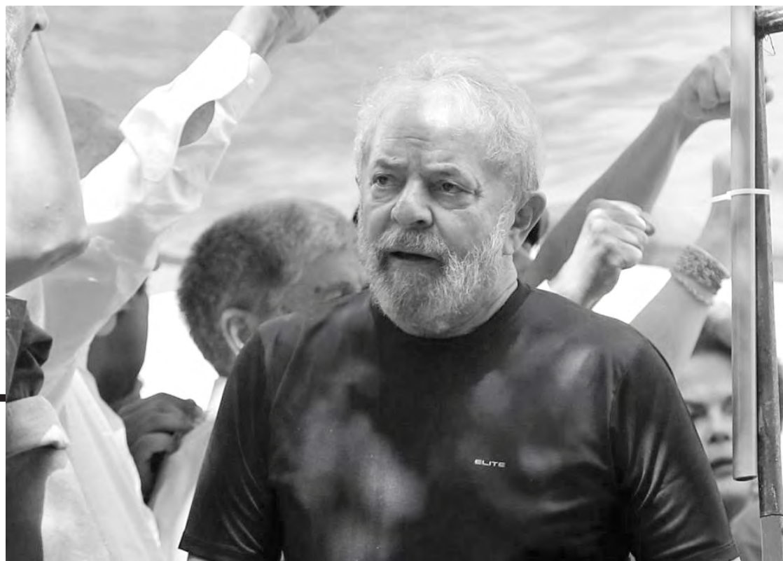
Los trabajadores rompieron con Lula por gobernar para los ricos

ajuste y por Fuera Temer que la CUT y el PT se negaron a darle continuidad.