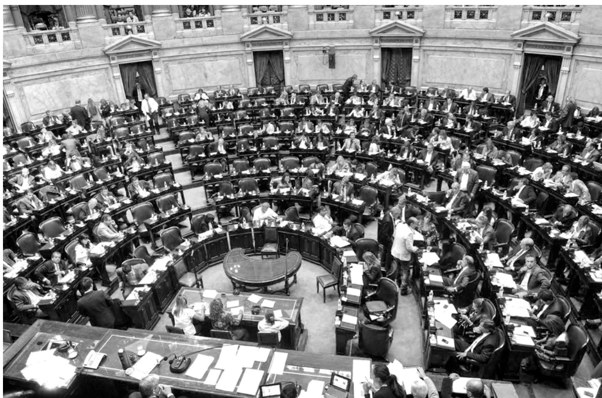
Macristas, peronistas y radicales: todos unidos aumentándose las dietas

La propuesta del aumento de la dieta es compartida por la mayoría de los legisladores patronales. Todos están de acuerdo con los privilegios. Dicen, para justificarse, que trabajan todo el año y que por eso es injusto lo que ganan. Es indignante. ¡Ellos no pueden vivir con más de 100.000 pesos mensuales, pero un jubilado sí debe poder vivir con menos de 8.000! Es un premio por haberle robado a los jubilados con la ley de reforma previsional y ser com-