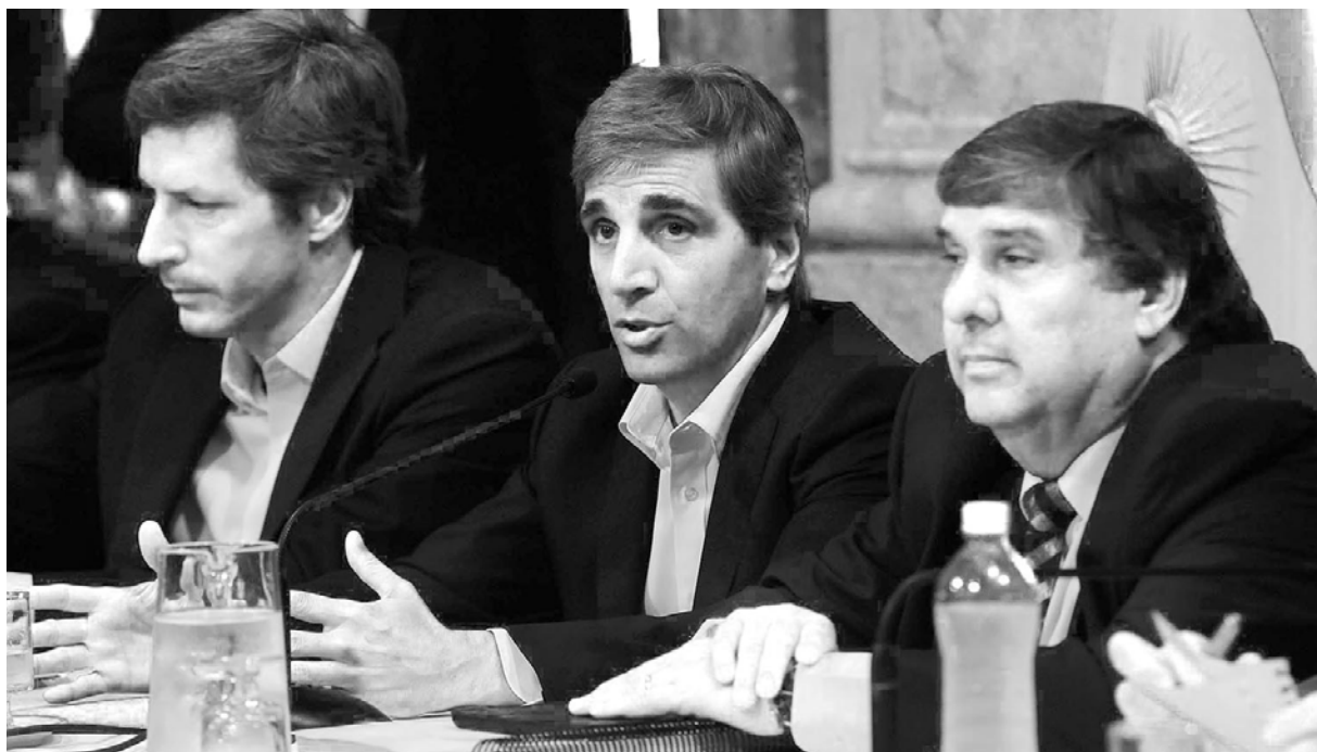
El ministro Caputo intentó justificar que tener una empresa en un paraíso fiscal "no es delito"

Pero eso no fue todo. Se le preguntó por qué justamente Noctua Partners se había beneficiado cuando el ministro lanzó el escandaloso bono a 100 años y por qué en todos los casos de nuevo endeudamiento apa-