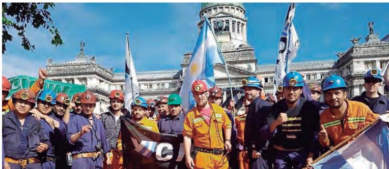
La lucha de Río Turbio llegó a la Capital

Los trabajadores de Yacimientos Carboníferos Fiscales de Río Turbio instalaron una carpa frente al Congreso “para hacer saber la lucha que estamos llevando adelante los trabajadores de Río Turbio y nuestras familias”, difundieron en un comunicado, y agregan “seguiremos en lucha por la continuidad de la productividad y puesta en marcha del Yacimiento Carbonífero de Río Turbio y de la Central Termoeléctrica Río Turbio, por la reincorporación de los despedidos