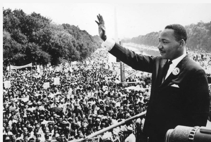
Movilización en 1963 en Washington por los derechos de los afroamericanos

Estos logros llevaron a la declinación de las movilizaciones, mientras se mantuvieron el racismo y la desigualdad social para la mayor parte de la población afroamericana, que siguió siendo pobre. Es que el capitalismo yanqui recrea la desigualdad y el racismo para su dominación de clase. Los casos de Colin Powell y Condoleezza Rice, primeros secretarios de Estado afroamericanos durante la presidencia de Bush, y del mismo Barack Obama, primer