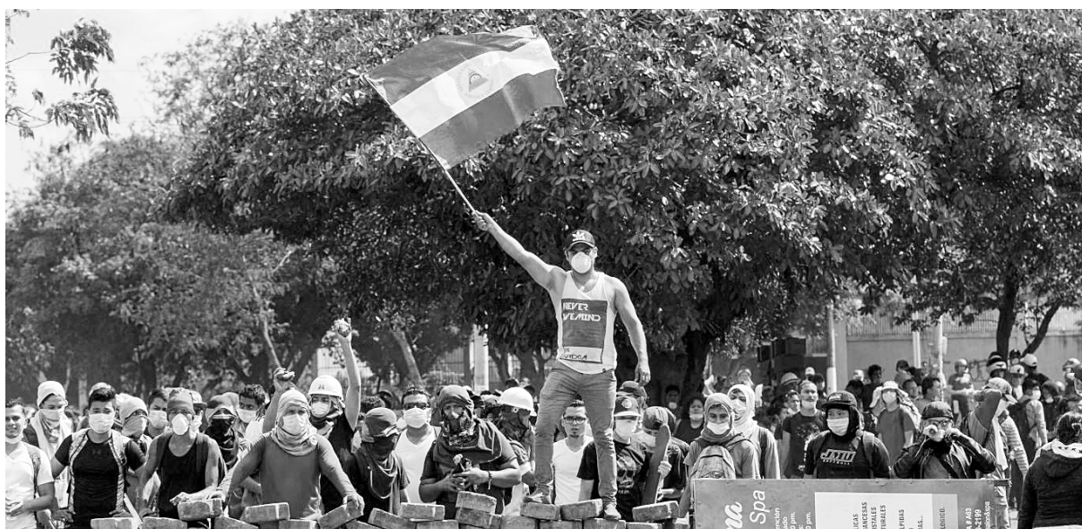
Barricadas protagonizadas por sectores populares y la juventud coparon Managua al grito de: “¡Que se vaya Daniel! (Ortega)”

El de Daniel Ortega y su esposa Rosario Murillo, es un gobierno burgués que aplica las recetas del FMI contra su pueblo que utiliza las banderas y símbolos del sandinismo y la revolución de 1979, como un recurso propagandístico para mantenerse en el poder mediante la represión, el control arbitrario de todas las instituciones del régimen y la realización de elecciones fraudulentas.[...] El FSLN se alió con los sectores más derechistas en el Congreso para aprobar una ley que penalizaba el aborto terapéutico que