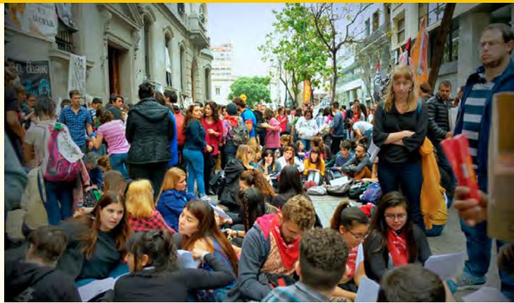
Los estudiantes llevan su reclamo a la Legislatura