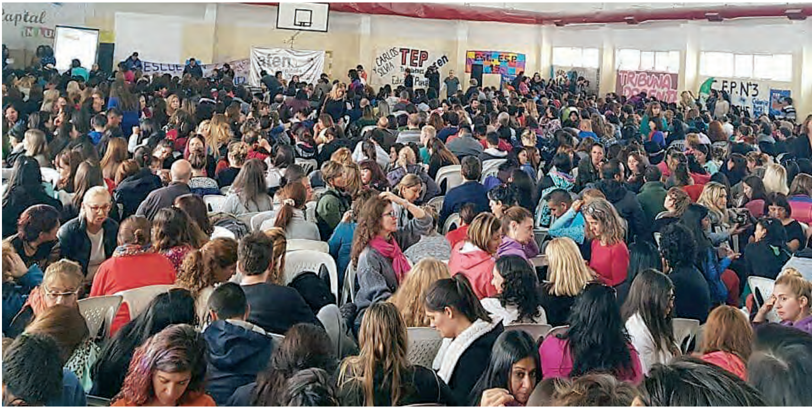
Una de las multitudinarias asambleas que ratificó el paro

Los docentes estamos en plan de lucha desde la primera semana de marzo, cuando el gobierno se negó a constituir la mesa de discusión salarial, que tuvo su último encuentro el 20 de febrero. En abril se dio una verdadera rebelión a partir de la asamblea del día 11, con más de 2.200 participantes en Capital, la seccional que reúne cerca del 50% del total de afiliados. En el resto de las seccionales la participación también fue numerosa.