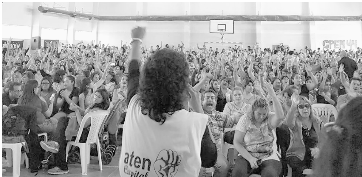
El sindicalismo combativo se apoya en las asambleas y la democracia de base

tal vez y sea cada vez más un polo alternativo nacional a la burocracia sindical. Lamentablemente los compañeros del PTS no se han sumado, a quienes los llamamos a rever su postura equivocada (ver columna).