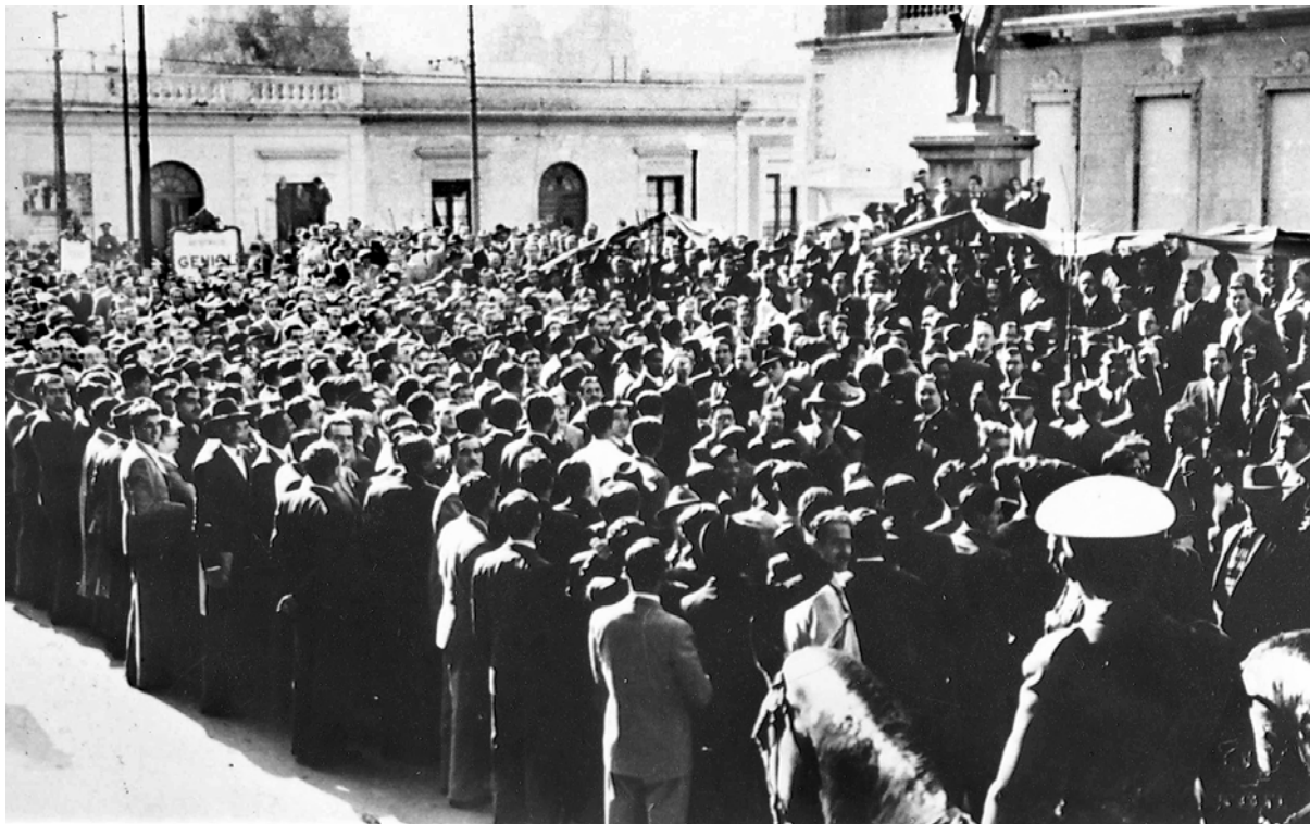
Acto estudiantil frente a la estatua de Rafael García ex profesor tradicionalista. Córdoba, calle, Obispo Trejo y Caseros. 15/8/1918

Los estudiantes le exigieron al gobierno del radical Hipólito Yrigoyen la aceptación de sus demandas. Pasaron algunos meses y, ante la falta de respuesta, la Federación Universitaria de Córdoba decidió el 9 de septiembre tomar las instalaciones y asumir la dirección de la