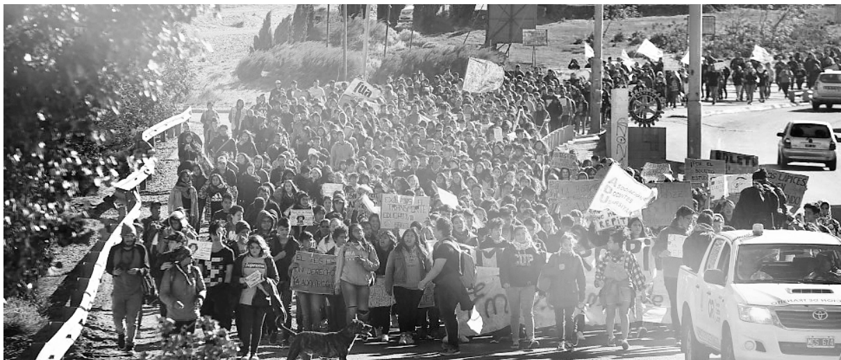
Lucha histórica de maestros y estatales contra el ajuste de Macri y Arcioni

Ya son más de diez los organismos estatales que se encuentran ocupados en toda la provincia. Entre ellos el Ministerio de Educación, el Área Programática de Esquel, Bosques, delegaciones