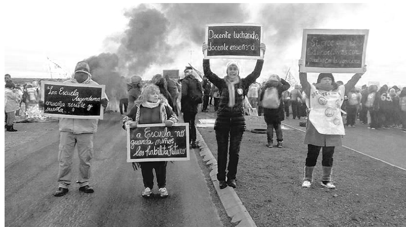
Los docentes llevan cuatro semanas de paro

La lucha de los estatales y docentes chubutenses es histórica.