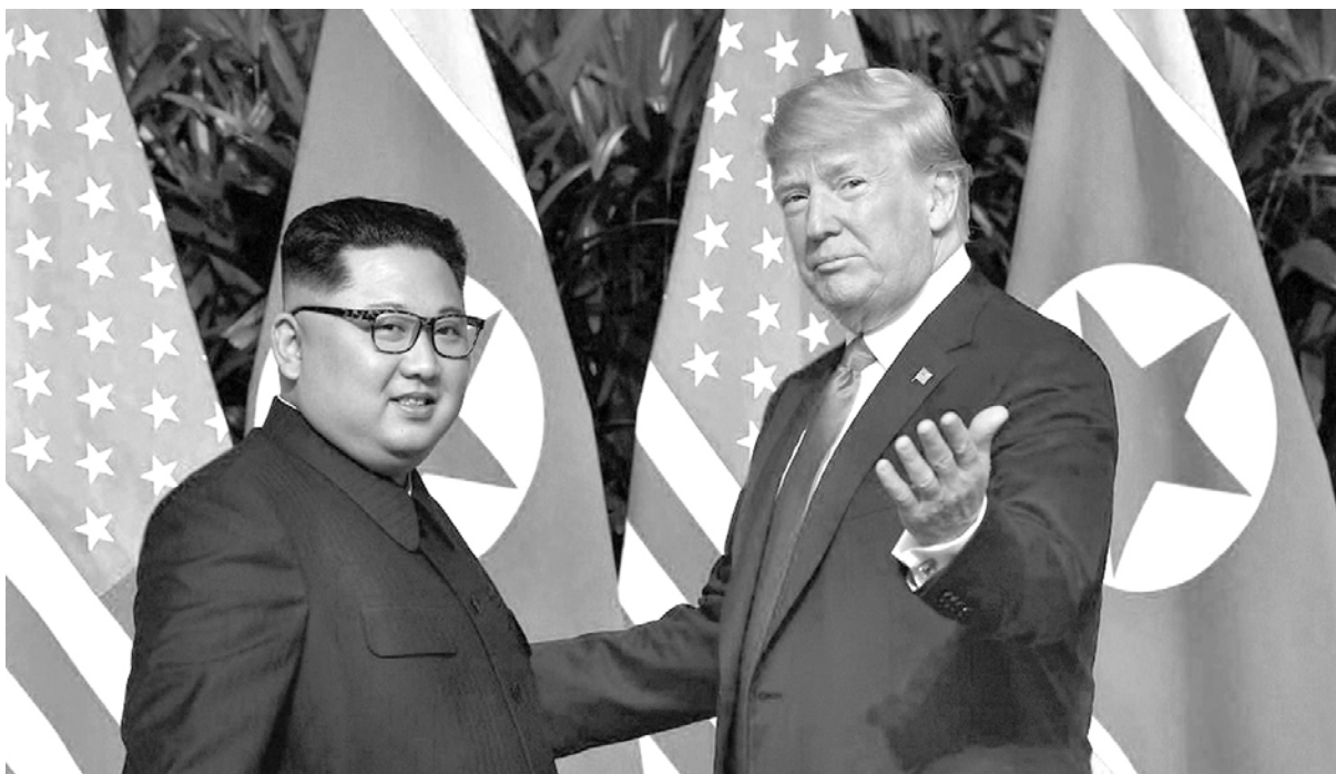
Los dos líderes compartieron tribuna en Singapur

Finalmente se concretó un encuentro que parecía impensado hace tiempo. Las imágenes de Trump y Kim en su cumbre de Singapur pasaron al álbum de la historia, como la de Nixon y Mao en Pekín en 1972. Pero en realidad está muy lejos de aquellos protagonistas. No solo por la diferencia en las personalidades sino porque aquí hubo “mucho ruido y pocas nueces”. Muchos concuerdan en que fue una cumbre vacía de acuerdos concretos y más un gran show. Sin embargo, es parte de un acuerdo político contrarrevolucionario.