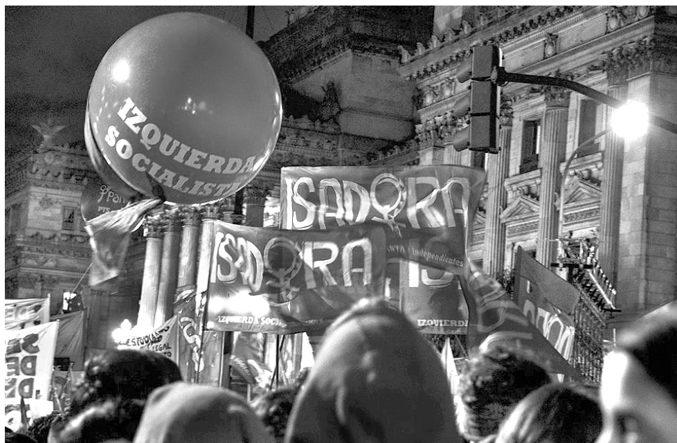
Frente al Congreso esperando la votación

vienen sumando a nuestra agrupación. Sin ellas, hubiera sido imposible lograrlas. Las queremos invitar a todas para que nos sigan acompañando.