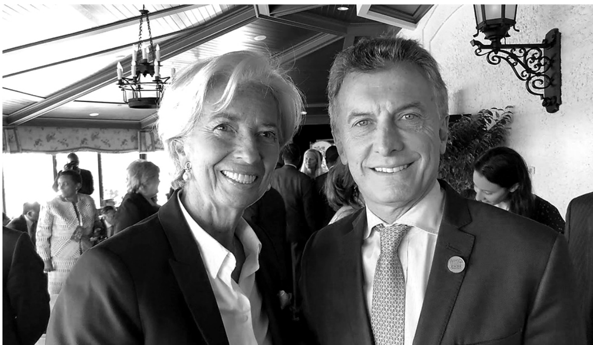
Lagarde y Macri festejan el acuerdo que traerá más ajuste contra los trabajadores y el pueblo

El acuerdo es para aplicar un megajuste que se sumará al que ya se viene realizando. Recordemos que, en medio de la corrida cambiaria, el ministro Dujovne había anunciado un recorte que llevaba la meta del déficit fiscal 2018 de 3,2% a 2,7% del PBI. Ese es el ajuste 2018, que se suma a los tarifazos y a la devaluación que hizo subir la inflación y liquida salarios y jubilaciones. Para 2019 el ajuste es mayúsculo: de una meta de 2,2% se pasa a 1,3%, con un recorte estimado en aproximadamente 200.000 millones de