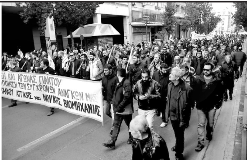
Movilización de trabajadores griegos contra el ajuste de Tsipras y el FMI

Los gobiernos griegos cumplieron a rajatabla el ajuste que exigía el Fondo. En medio de este proceso, la bronca y la resistencia popular, con huelgas generales incluidas, llevaron al gobierno en 2015 a la coalición de izquierda Syriza, que ganó su popularidad repudiando el ajuste y llamando a romper con el FMI y la Unión Europea. Sin embargo, y a pesar de un plebiscito donde