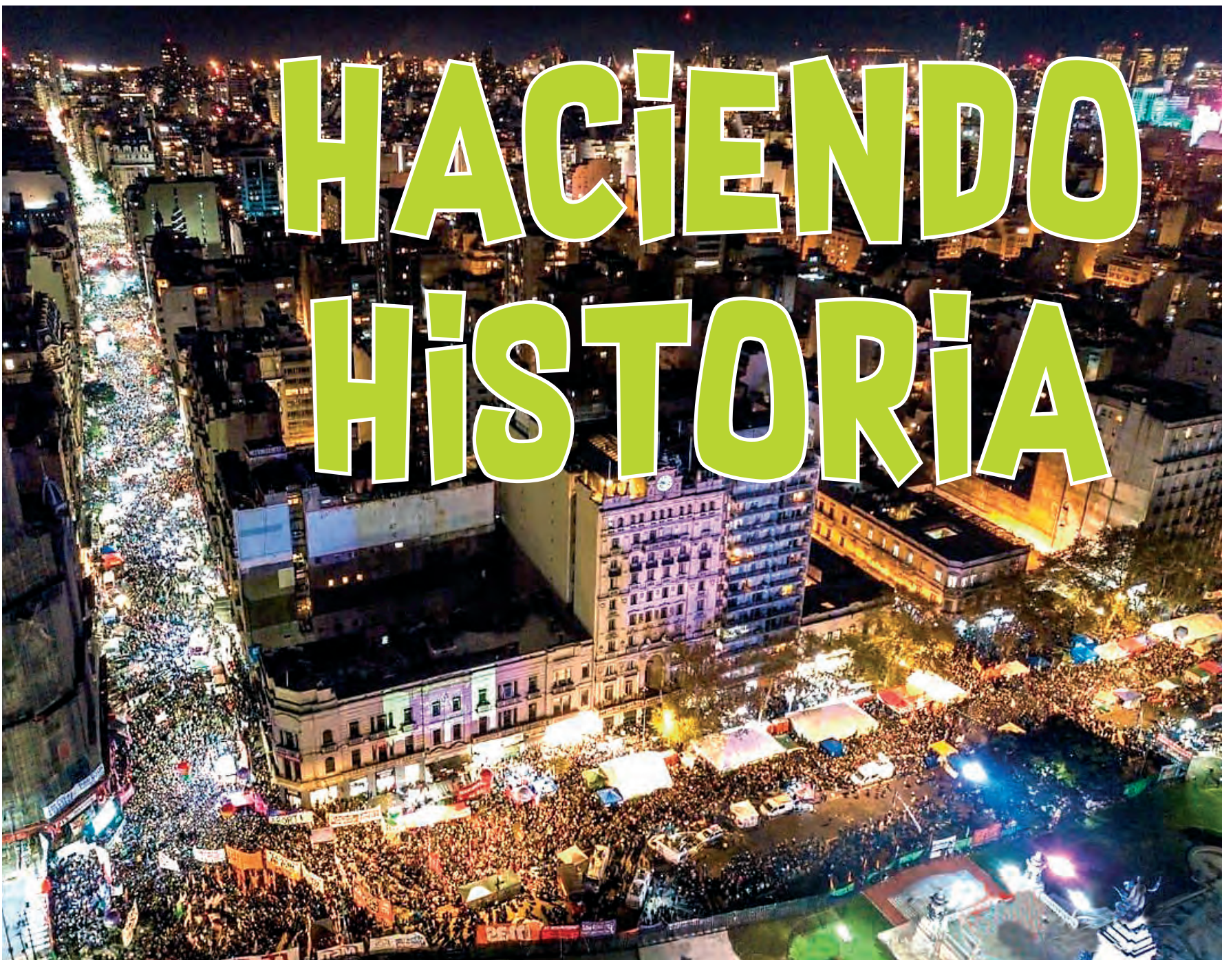
Vista aérea de la masiva marcha de apoyo al proyecto de la campaña