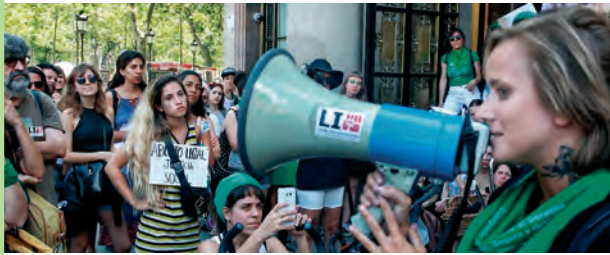
Concentración frente al consulado argentino. Barcelona

En varios países se realizaron acciones solidarias con la pelea de las mujeres argentinas. En Paraguay, el martes 12 de junio se realizó una concentración en la embajada argentina para expresar el apoyo a esta lucha. El 13 de junio, las brasileñas impulsaron una actividad frente al consulado argentino en Río de Janeiro. En Barcelona, impulsadas por las compañeras de Lucha Internacionalista-UIT/CI, se realizó una concentración en el consulado argentino con decenas de activistas al grito de “sí no hay aborto legal, que kilombo se va a armar”.