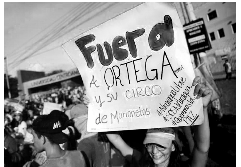
Se profundizan el repudio y la rebelión a Daniel Ortega

Los empresarios y la Iglesia, que apoyaron al gobierno hasta hace muy poco, se ponen hoy como promotores del “diálogo”. El diálogo, al cual concurren empresarios, la Iglesia (con apoyo público del Papa), dirigentes estudiantiles de las protestas y también campesinos (en el marco de la Alianza Cívica que formaron), es con el gobierno de Ortega. Este aceptó que la Co-