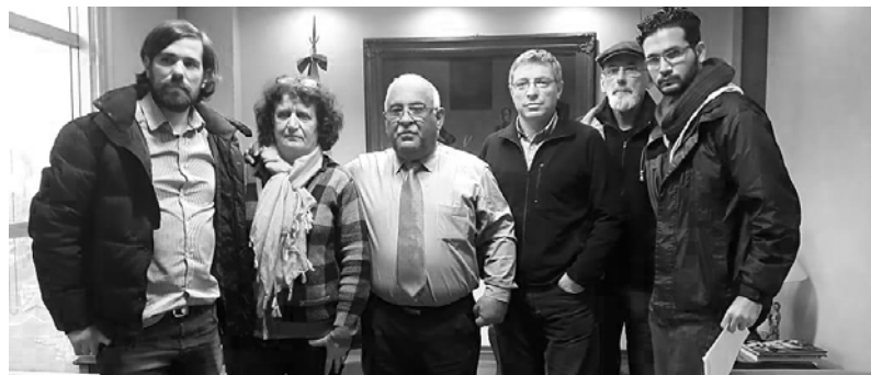
El embajador venezolano (centro) recibió a la delegación