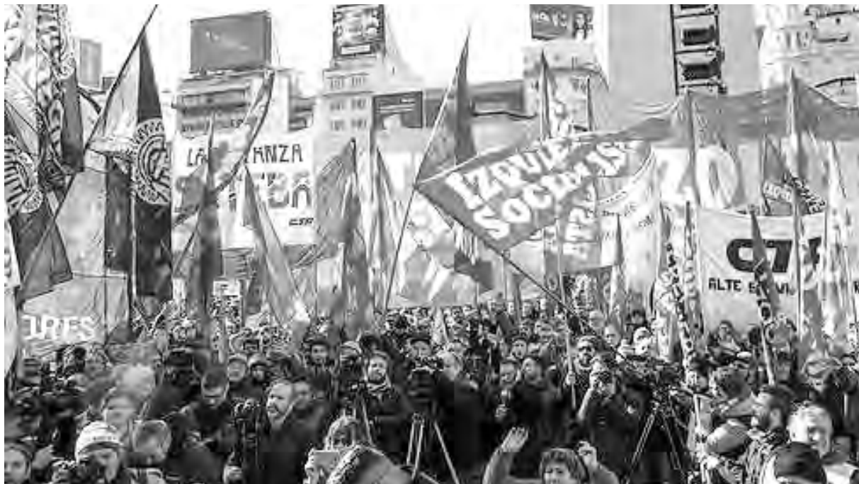
El sindicalismo combativo y la izquierda cerraron la jornada de cortes con un acto en el Obelisco

En Neuquén, desde temprano, se cortó la ruta 7 frente a las fábricas de cerámica, donde estuvieron presentes los docentes de ATEN Capital, encabezados por Angélica Lagunas, junto con el sindicato de ceramistas, los trabajadores de MAM y textiles, para luego marchar hasta la casa de gobierno con 5.000 trabajadores movilizadas, donde se realizó un acto. En Córdoba se llevó a cabo un corte en el puente Centenario y posteriormente se hizo un acto en Luz y Fuerza y una