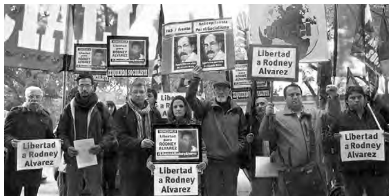
Concentración frente a la embajada de Venezuela