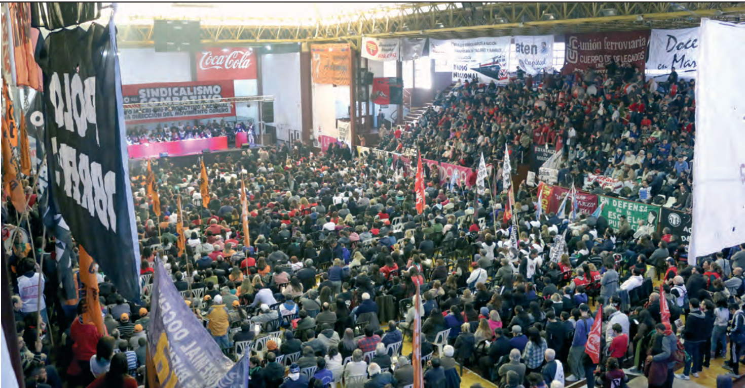
El estadio cubierto de Lanús colmado por delegados y activistas combativos

El intercambio de experiencias, el debate abierto y franco, y la voluntad política que tendremos que seguir poniendo entre todos nos posibilitará avanzar ante los próximos desafíos. No partimos de cero, sino de este gran plenario sindical que logramos protagonizar el 23 en Lanús.