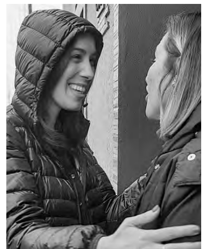
Vidal va a los timbreos pero no se animó a aparecer por Moreno

El “estilo” de la gobernadora, de los aportantes truchos, es que no fue a la escuela por miedo a ser repudiada por su responsabilidad política en las muertes. Pero sí es su “estilo” hacer sus repudiables timbreos en vistas a las elecciones. O como se la vio el mismo día en que velaban los restos de Sandra y Rubén, fotografiarse con Macri anunciando “créditos” para los jubilados. Por eso los docentes cantan “no fue tragedia, no fue casual, es el ajuste del gobierno de Vidal”.