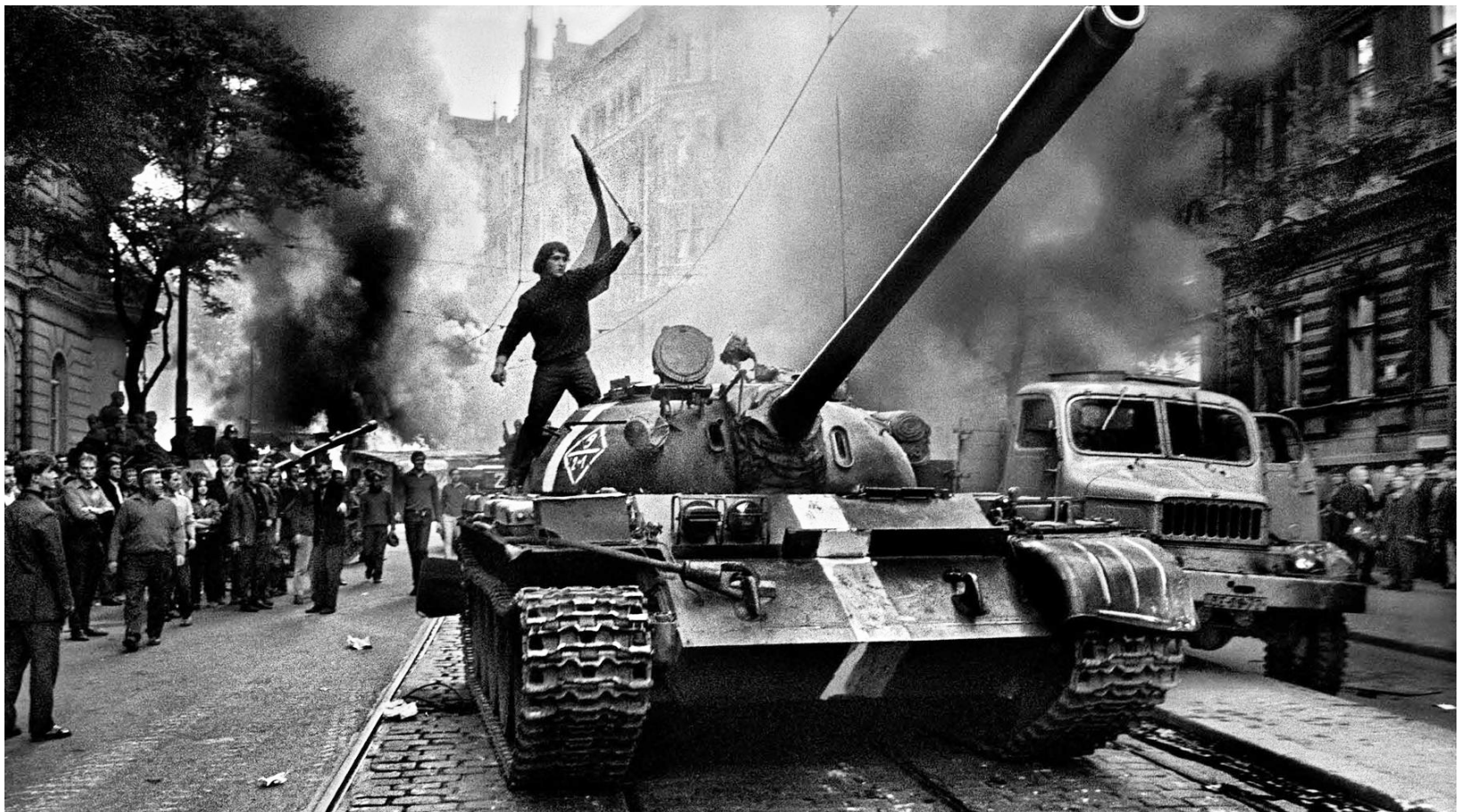
Resistencia a la entrada de los tanques soviéticos en Praga, 1968

Desde los años '50, la burocracia estalinista checoslovaca implementó procesos judiciales y purgas que se cobraron unas 40.000 víctimas. Junto con la falta de libertades democráticas y el terror, se fue acentuando el deterioro del bienestar de la población a raíz de reformas cada vez más procapitalistas sobre la economía centralmente planificada (el producto nacional bruto pasó de 7% en 1961 a -0,1% en 1963).