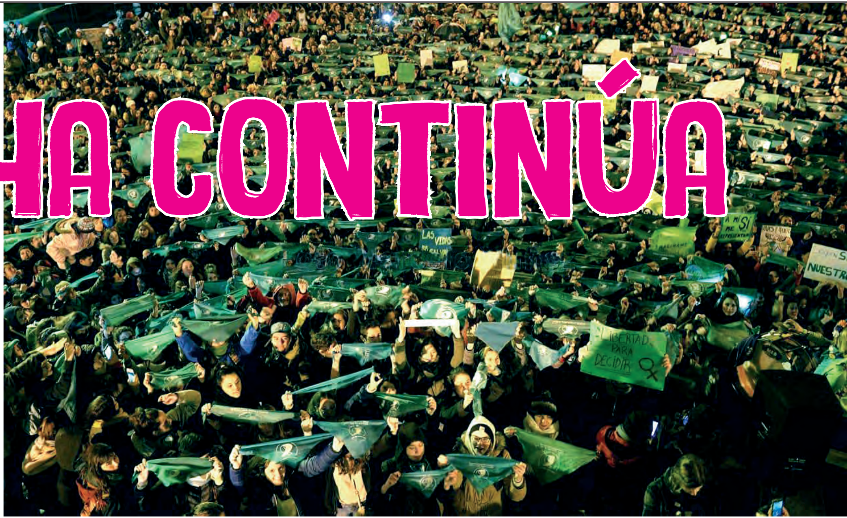
Pañuelazo en el Congreso durante la vigilia del 8A