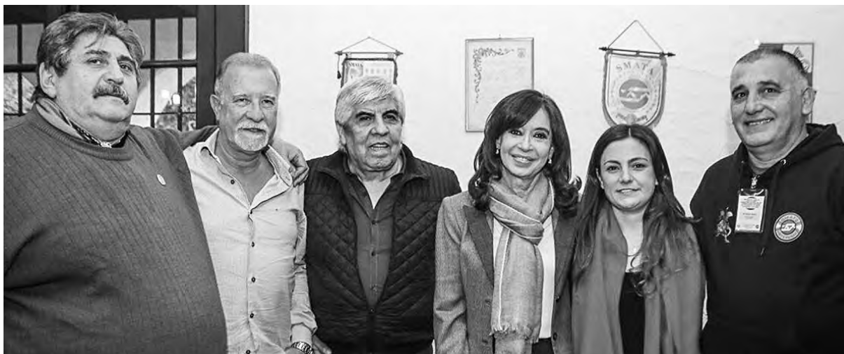
Cristina Kirchner “reapareció” en un acto del Smata

La ex presidenta rompió el silencio... para juntarse con Ricardo Pignanelli y Hugo Moyano. “Se verá la posibilidad de unificar el peronismo para volver a ser gobierno”, declaró el camionero a la salida del encuentro. Todas las fracciones del peronismo, incluido el kirchnerismo, van mostrando día a día que no son salida frente al ajuste de Macri y el FMI.