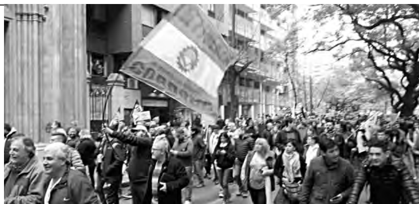
Obreros y estudiantes se unen en defensa de la EPEC

Los acuerdos políticos de Macri y Schiaretti se conjugan para entregar a la EPEC a los grandes empresarios