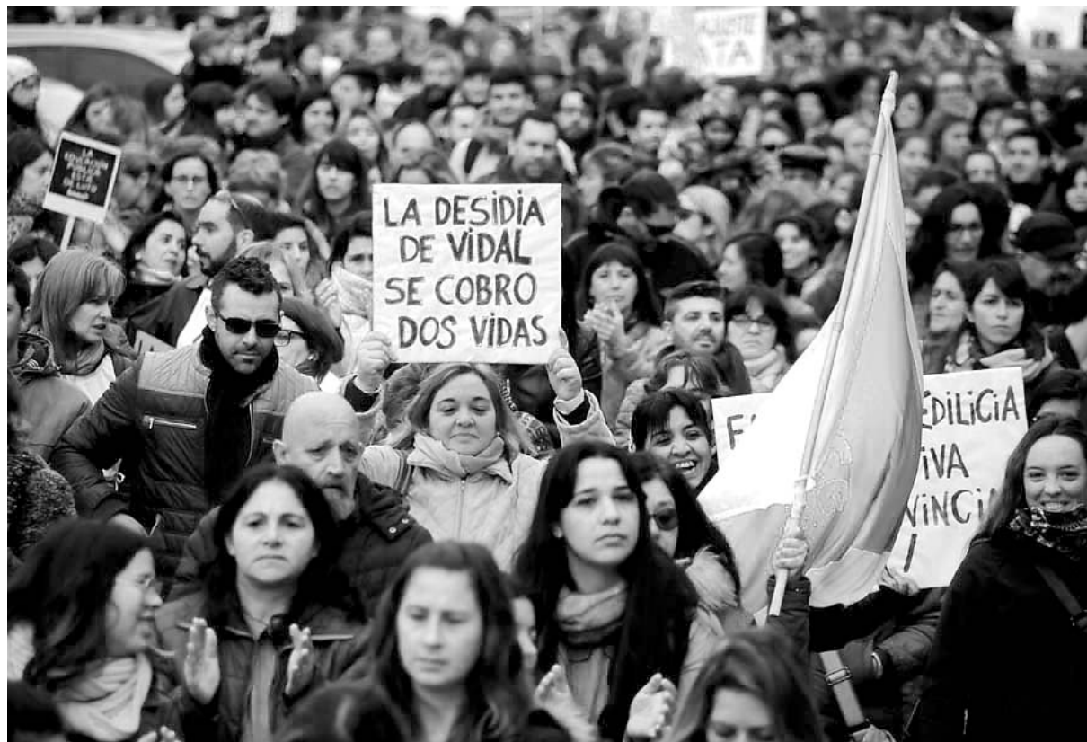
Se dieron masivas movilizaciones en Moreno y en el resto de la provincia de repudio a esta tragedia evitable

aunque parezca increíble, inspectores y directivos presionaron a los docentes a que sigan dando clases. En los distritos multicolores y autoconvocatorias como José C. Paz o Malvinas Argentinas, enormes movilizaciones de docentes y padres impusieron la suspensión e inmediata asistencia del consejo a las escuelas para comenzar los arreglos. ¡Pero la política de Vidal es que los gasistas cierran las llaves de gas y se retomen las clases! Es fundamental que docentes y padres nos pongamos firmes para que no se quede ningún niño, auxiliar ni docente en las escuelas hasta que estén en condiciones. ¡No podemos arriesgarnos a nuevas muertes!