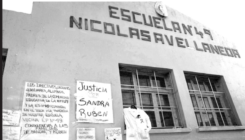
Frente del establecimiento donde el ajuste de Vidal causó dos muertes