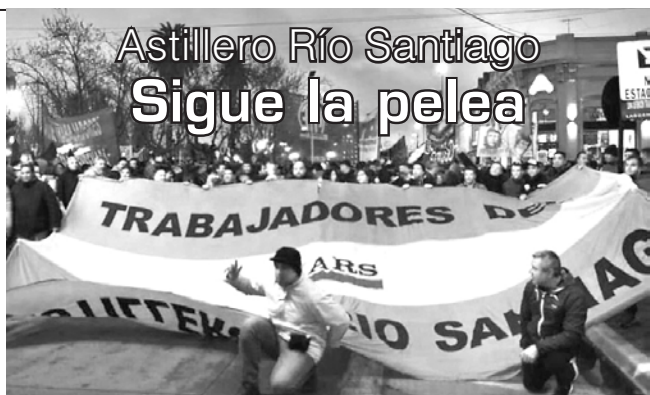
En el ARS se movilizan contra el vaciamiento y la privatización