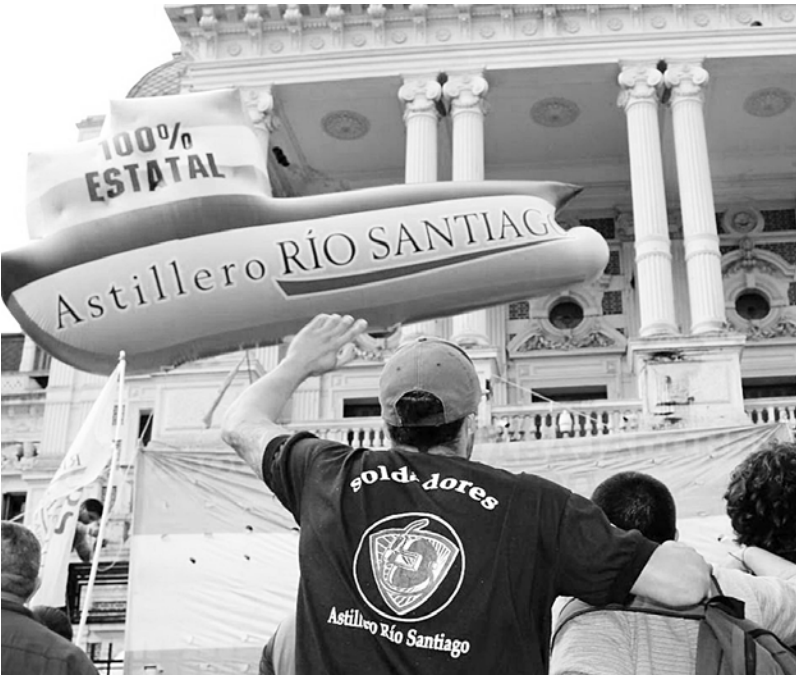
Continúan las luchas de los estatales contra el ajuste

partes. Son miles los que salen a la calle a luchar. Por eso tenemos que exigir el adelantamiento del paro general, que sea por 36 horas y con movilización a Plaza de Mayo y todas las plazas del país. Tenemos que debatir esto con todos nuestros compañeros de trabajo, en todos los conflictos y movilizaciones, hacer asambleas