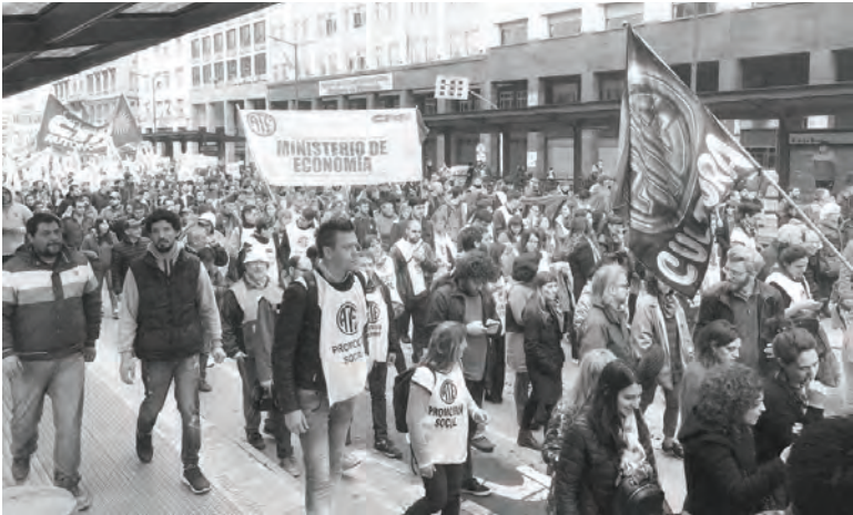
Más de 10.000 estatales se movilizaron contra el cierre de ministerios

Autoconvocados, quienes lo hagamos. No se puede dilatar más la lucha esperando a que la burocracia se decida a luchar en serio. Convocar al Plenario Provincial de Delegados combativos es fundamental para disputarle la conducción de la lucha a la burocracia. Las agrupaciones de oposición no pueden seguir dándole vueltas. Un plan de lucha por la defensa de la escuela pública y plata para educación y salarios, no para el FMI, con los docentes unidos a los familiares y alumnos, es el camino que impulsamos desde Izquierda Socialista y Docentes en Marcha.