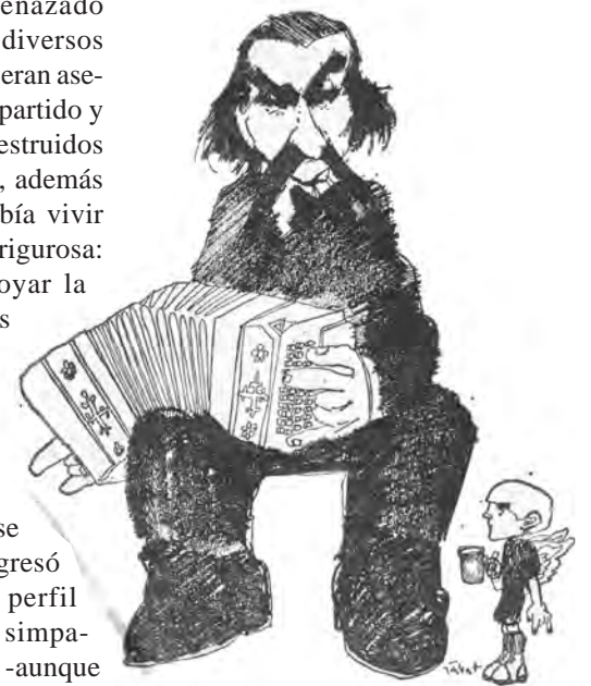
Caricatura hecha por Sabat

Tras el golpe de 1976 se exilió en Venezuela. Regresó años después con bajo perfil y, tras mostrar algunas simpatías con el kirchnerismo —aunque siempre crítico del chavismo —se acercó a varios actos del FIT y fue ovacionado por la multitud en el acto de Atlanta de finales de 2016. Orgulloso de su pasado, reconocía en Izquierda Socialista a la organización que encarnaba “la tradición de aquel embrión de partido revolucionario que fue el glorioso PST”. Su última aparición pública fue, justamente, en la reciente presentación del segundo