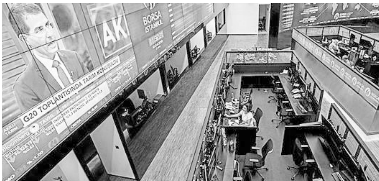
La moneda turca, la lira, turca cayó 54% en un año

Y ahora, con la suba de los intereses en Estados Unidos y en otros países imperialistas, se ha cerrado el grifo de dinero extranjero, exponiendo el país a la especulación y hundiendo la lira. Erdogan se está quejando de un “ataque” económico desde los Estados Unidos (sin mencionar directamente su nombre) e intenta calmar los ánimos con gestos populistas antiimperialistas. Por supuesto que Trump echó leña al fuego con la crisis del clérigo y lo que quería era no solamente la expatriación de Brunson sino, sobre todo, presionar a Ankara políticamente por su línea en asuntos exteriores. La oligarquía turca intenta extender su hegemonía económica en Oriente Medio a través de operaciones militares y acuerdos diplomáticos. Por esta razón interviene militarmente en la guerra de Siria para poder estar en la “mesa de la reconstrucción”. También choca con los Estados Unidos que apoyan