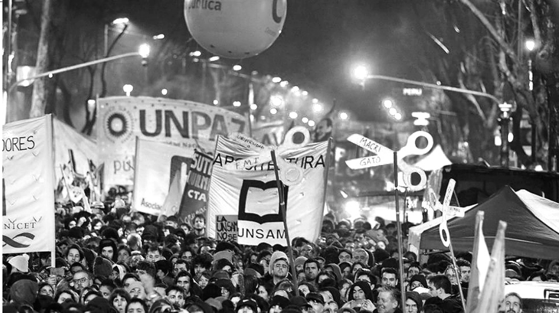
Centenares de miles se movilizaron el 30A a Plaza de Mayo bajo la lluvia

incluir el reclamo universitario en su lamentable cadena nacional del lunes 3. Pero lo cierto es que para el gobierno está primero garantizar el pago de la deuda y el plan de ajuste recargado acordado con el FMI. Ahora se va a discutir el presupuesto de 2019 y docentes y estudiantes tenemos que dar una pelea concreta contra el desfinanciamiento. Desde la Juventud de Izquierda Socialista venimos siendo parte de esta rebelión en todo el país. En todos lados estamos en primera fila de cada medida de fuerza y estamos a fondo por el triunfo del