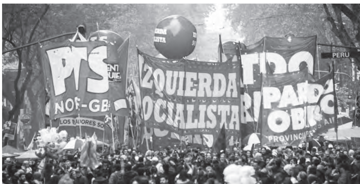
Postulemos al Frente de Izquierda como alternativa política para la clase trabajadora frente a la crisis

Lo que debemos seguir intercambiando es sobre cuáles son los ejes