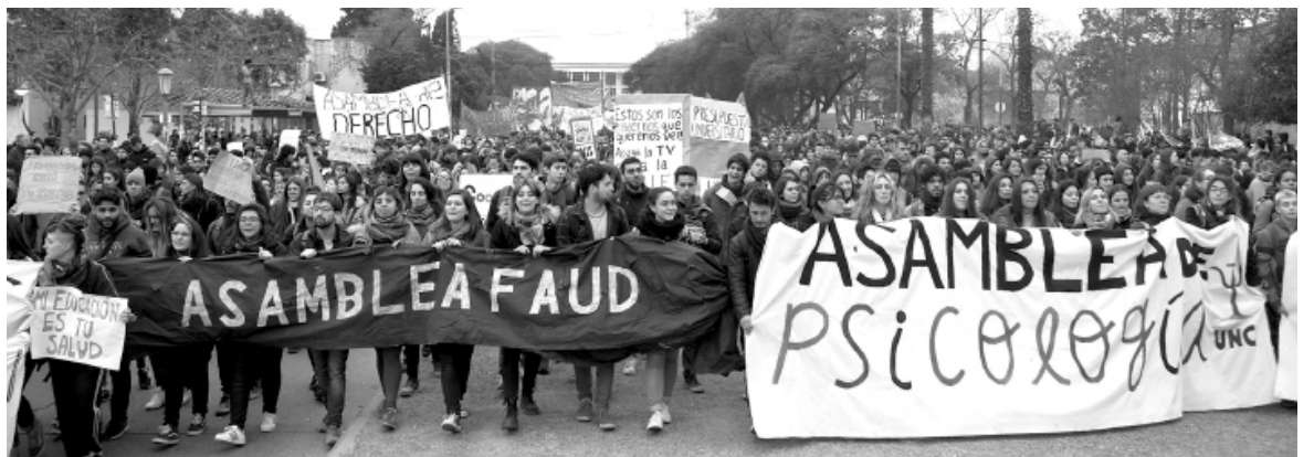
La masiva marcha de Córdoba abrió el conflicto

El conflicto sigue creciendo. La sorprendente marcha de 100 mil estudiantes y docentes del 22A produjo un salto en la movilización. A partir de ahí, se masificaron las asambleas y a la toma de la facultad de Artes se sumaron Filo, Psico, Arquitectura, Comunicación y Sociales y el