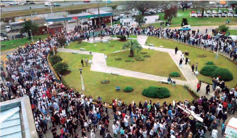
Los trabajadores del hospital Posadas en uno de sus "abrazos" contra los despidos

Mientras el gobierno sigue con su ataque a la salud pública, en el hospital Posadas los trabajadores responden a los despidos con más lucha y organización. Las últimas semanas ochenta trabajadores de distintos servicios y especialidades fueron despedidos, a lo que se le suma el reclamo de los médicos residentes que hace tres meses no cobran los salarios. Esto ha generado un repudio generalizado no sólo entre los trabajadores sino también entre los pacientes y vecinos del hospital, que ven un artero ataque contra un hospital emblemático de la zona que brinda asistencia a cientos de miles de pacientes al año. Los despidos son indiscriminados: cirujanos cardiovasculares, una pediatra especializada en gastroenterología, cardiólogos infantiles, dos anatomatólogos, neumonólogos, entre otros, forman parte de la nómina de los