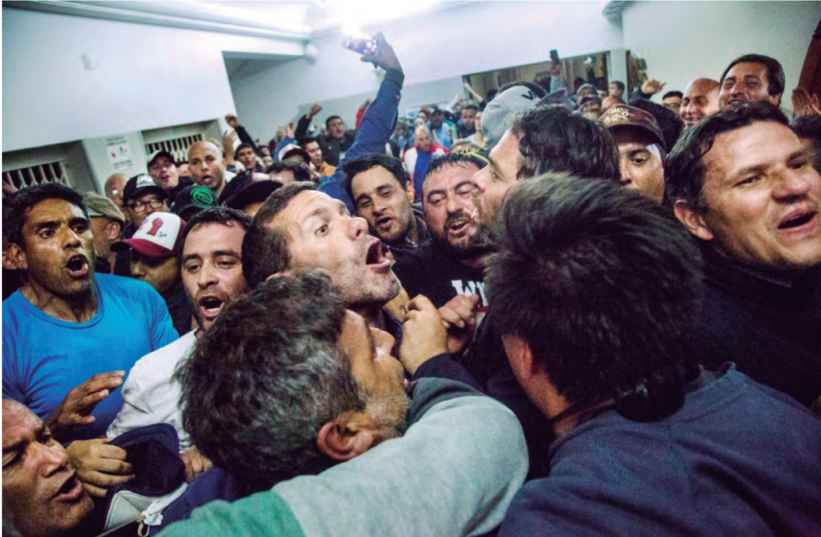
Días atrás, los trabajadores del Astillero Río Santiago durante la toma de la fábrica en defensa de sus puestos de trabajo y por salarios

—Porque la situación no se aguanta más. Estamos ante un gobierno antiobrero y propatral. No van más los despidos, que nos roben impunemente los salarios. El paro va a ser total porque se va a unificar todo el movimiento obrero contra el ajuste. Los estatales y docentes, que están a la vanguardia, con el movimiento obrero industrial, que sufre los despidos y el miedo a salir a luchar ante una burocracia que les mete miedo.