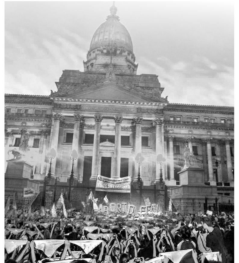
Este 28S deberá ser otra jornada histórica de las mujeres

Este 28S nos encontrará nuevamente en las calles y tenemos que ser otra vez miles para responderles a los cuarenta senadores “dinosaurios” que votaron en contra. Por el derecho a decidir sobre nuestro cuerpo que niegan los que cortan nuestra libertad y también nuestro deseo. También saldremos a las calles a gritar por las que ya no tienen voz: las mujeres pobres muertas por abortos clandestinos. Nos sobran los