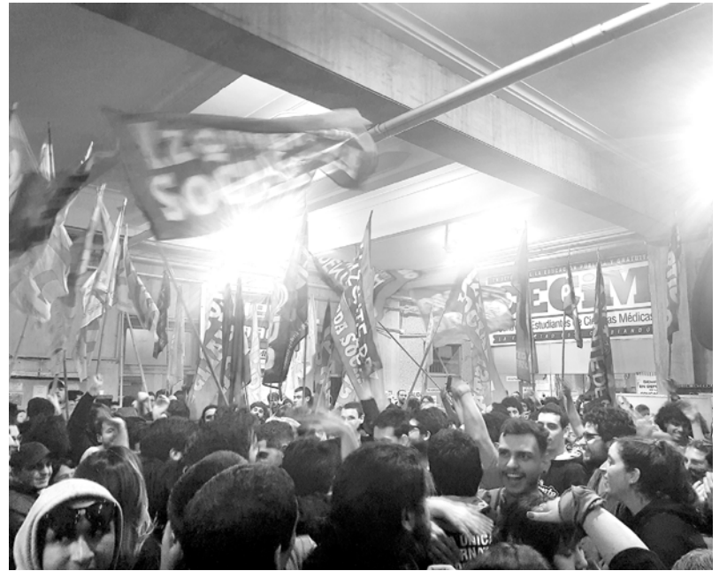
La izquierda desplazó a la Franja Morada de la conducción de Medicina

En Farmacia la conducción del PO terminó congelando el conflicto que se había dado sobre el fin del primer cuatrimestre, y las asambleas en el marco del paro fueron testimoniales. Allí sostuvimos nuestra presentación y trabajo político junto a independientes que no encuentran