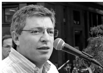
Escribe Juan Carlos Giordano Diputado nacional electo Izquierda Socialista/FIT

Muchos trabajadores o jóvenes podrán pensar que ante la brutal crisis a la que nos está llevando Macri puede ser una alternativa el kirchnerismo. Son sectores que respetan a la izquierda pero todavía no la ven como alternativa de gobierno. Queremos dialogar con ellos centrando el debate sobre cuáles tienen que ser las medidas de fondo que hay que aplicar para salir de la crisis y combatir los males del capitalismo de saqueo de Macri. ¿Qué dicen los economistas y políticos K sobre la deuda y el pacto con el FMI? ¿Hay que “renegociar” la deuda o dejarla de pagar?