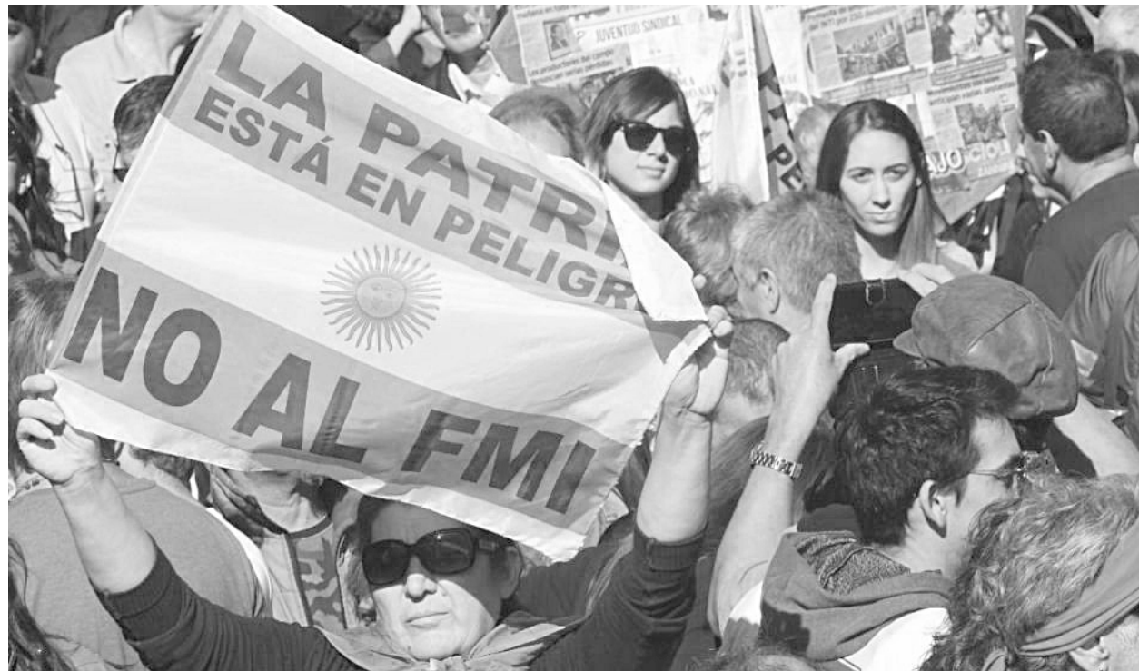
El kirchnerismo hizo un acto contra el FMI pero dice que hay que pagar la deuda

La deuda externa es el mal de los males. ¿Qué dicen los economistas y políticos kirchneristas al respecto?