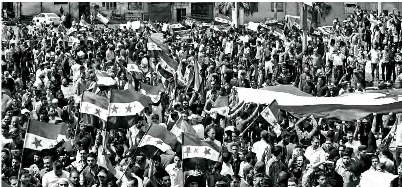
Movilizaciones en repudio al ataque que planea el régimen contra Idlib, el último bastión rebelde

La operación de Idlib es el último anillo de la Operación Barrido, llevada a cabo por Assad y sus aliados. Al final de 2015, el régimen de Assad lanzó los contraataques apoyado por la fuerza aérea rusa, Hezbollah e Irán, que proveyeron milicias y comenzaron a capturar una a una las regiones controladas por la oposición. Las fuerzas del régimen capturaron primero Aleppo, luego Damasco rural, y posteriormente se dirigieron a la región de Daraa, donde una insurrección había comenzado en 2011. Grupos armados y civiles que vivían en estas regiones capturadas habían sido relocalizados en Idlib como