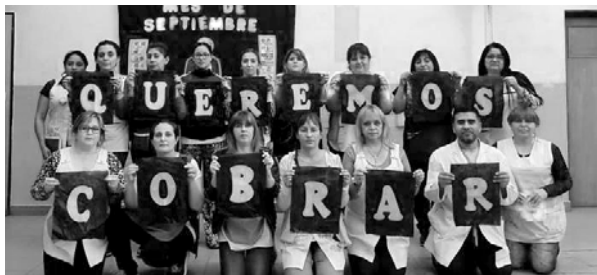
Maestros santacruceños reclamando por su salario

La gobernadora de Santa Cruz, Alicia Kirchner, pidió perdón por no pagar los salarios de los maestros y culpó a Macri porque “no le gira fondos”, frente a un acto espontáneo de docentes que la fueron a escrachar en Puerto Deseado. “¿Qué persona no va a pagar a la gente porque no quiere?” dijo. En la página del Ministerio de Hacienda se lee que ya había ingresado todo el dinero de coparticipación, incluido el Fondo de Incentivo Docente.