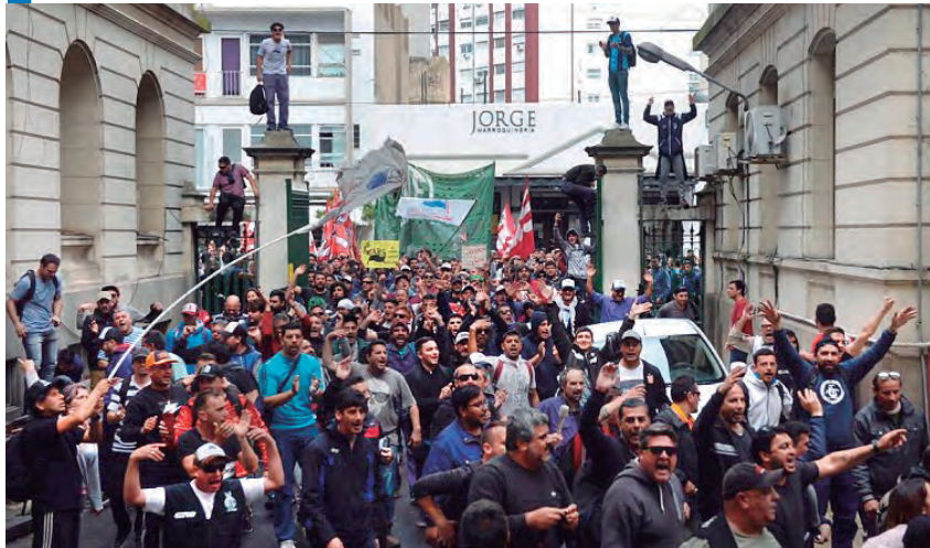
Frente al incumplimiento de la gobernadora Vidal los trabajadores tomaron el ministerio en La Plata

El martes 19 de septiembre los trabajadores del Astillero Río Santiago (ARS) decidieron tomar el Ministerio de Economía de la provincia de Buenos Aires. La resolución fue tomada en asambleas por sector y una asamblea general. La medida evidencia la bronca que reina entre los trabajadores por los constantes desplantes e incumplimientos por parte del gobierno provincial de Vidal. El último fue el desconocimiento del acta firmada el pasado jueves 13 de septiembre, donde el gobierno se comprometía a comprar insumos para continuar con los trabajos pendientes en la fábrica y a abrir una mesa de negociación por los descuentos que sufrieron los trabajadores.