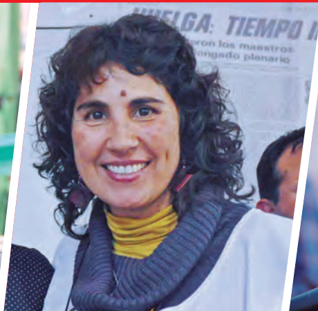
ANGELICA LAGUNAS DIPUTADA POR NEUQUÉN Y SEC. GRAL. ATEN CAPITAL