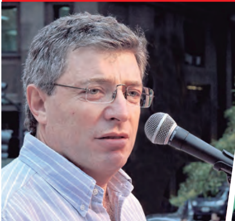
JUAN CARLOS GIORDANO DIPUTADO NACIONAL ELECTO