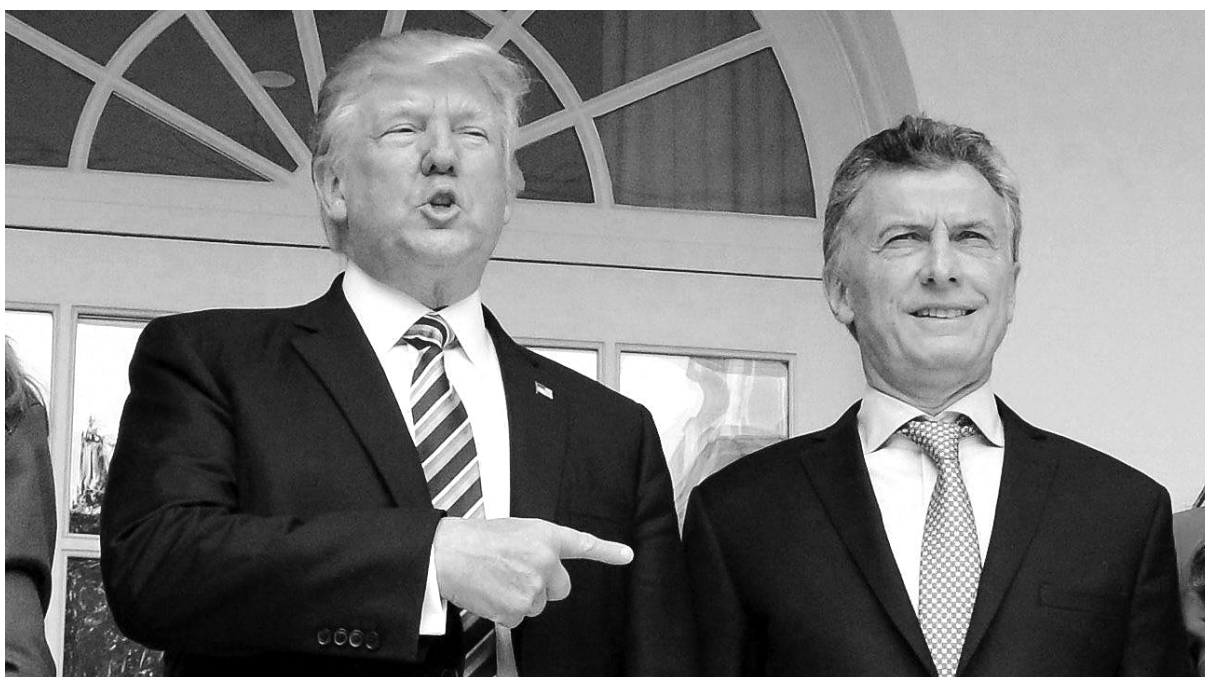
Trump señala a Macri como el elegido para aplicar el ajuste

El 30 de noviembre y el 1° de diciembre Buenos Aires será sede de la cumbre de líderes del Grupo de los 20 (G20). La reunión ocurrirá justo cuando se conoce que nunca en la historia se registró un número tan elevado de multimillonarios, con fortunas por un total de 8,9 billones de dólares (más del doble del PBI alemán), mientras se da el éxodo de una caravana multitudinaria de migrantes centroamericanos que huyen de la extrema pobreza y caos social en sus países, avanzando hacia Estados Unidos pese a las amenazas del racista y xenófobo Donald Trump, que ya apostó su ejército en la frontera y amenaza responder con balas. Esta desigualdad escandalosa no es más que el resultado de los negocios y políticas de saqueo que vienen a redoblar Trump, Merkel, Putin, el chino Xi Jinping y la plana mayor del imperialismo en la Cumbre del G20, sin dudar en seguir garantizándoles superganancias a ricos, bancos y multinacionales. ¡No podemos dejar de manifestarles nuestro repudio a los responsables del hambre, la miseria y el sufrimiento de millones de seres humanos!