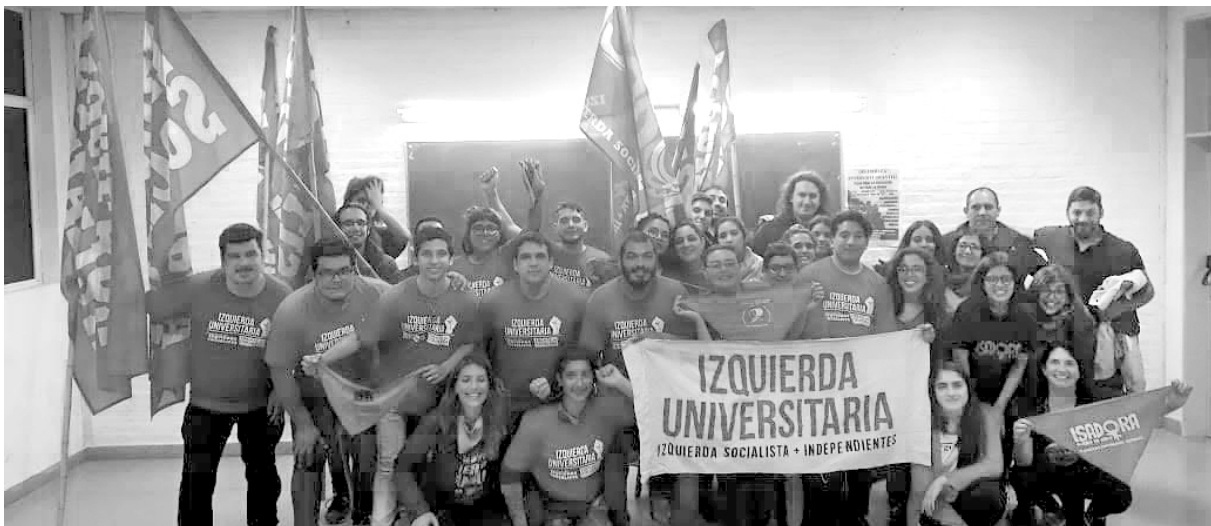
La lucha contra el ajuste en la universidad pública le dio el triunfo al FEI

Desde el FEI e Izquierda Socialista dimos una gran pelea contra el aparato del PJ de Malvinas Argentinas y el resto del peronismo. Ni El Puente (JUP, Descamisados, La Cámpora), que apareció en la UNGS para tratar de hacer del centro de estudiantes una unidad básica del PJ, ni el FUNyP pudieron contra la enorme campaña que dimos desde el FEI para seguir construyendo un centro que pelee