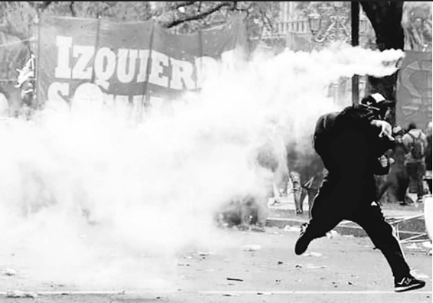
Represión en la Plaza del Congreso el 24 de octubre cuando se trató el presupuesto 2019

festantes que en algunos casos hasta fueron perseguidos y reprimidos desde Congreso hasta Constitución. Así lo vivió la columna de Izquierda Socialista, que junto a su militancia se retiró hasta 9 de Julio y San Juan perseguida por la policía y sus balas por más de quince cuadras. Mientras el gobierno acusaba a la izquierda de “violenta”, Cambiemos junto al PJ votaba el ajuste para 2019. La violencia y el caos contra el pueblo trabajador se “cocinó” en la sesión. Pichetto, del PJ, enterado de la detención de cuatro ciudadanos extranjeros, pidió su expulsión del país al mejor estilo