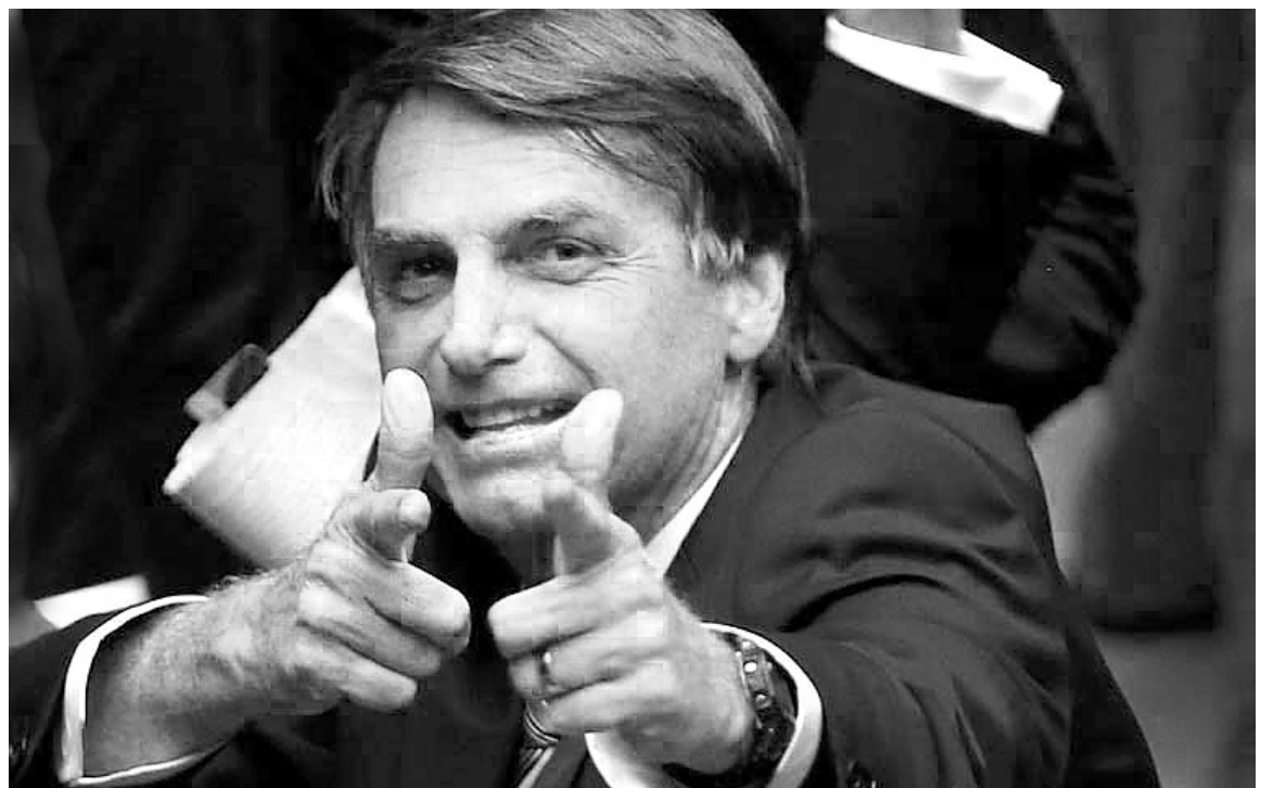
Bolsonaro atacará los derechos del pueblo trabajador

Brasil es, luego de Venezuela, el punto más alto de la crisis política y social en América latina. El impactante resultado electoral del ultraderechista Bolsonaro es la expresión de esa crisis y del fracaso de la izquierda reformista latinoamericana. En particular de Lula, Dilma y el PT, que tuvieron más de 15 años de gobierno con ajuste y corrupción. El triunfo de Bolsonaro abre todo tipo de incógnitas y debates sobre el porqué del avance de la ultraderecha. ¿Por qué millones, incluidos trabajadores y sectores populares, le dieron el voto? ¿Brasil va hacia una dictadura o hacia un nuevo fascismo?