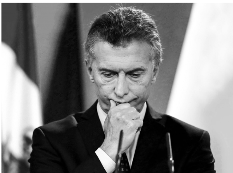
Macri, entre el repudio popular y las encuestas en picada

Pero Cambiemos hace agua por los cuatro costados. Y ya es imposible de disimular. Elisa Carrió, en otra época el “tanque” electoral que ponía Macri en la Capital, ya ha pasado de impre-