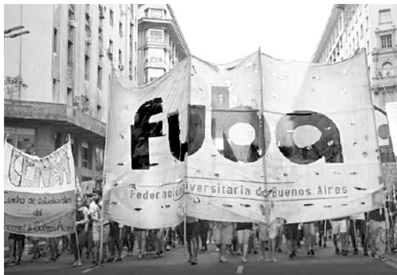
Un congreso burocrático que poco aporta en la lucha estudiantil

Los 50 años del Cordobazo encontrarán a la FUBA haciendo cualquier cosa menos discutir cómo organizarse junto al pueblo trabajador en las calles contra el ajuste de Macri, el FMI y sus aliados pejetistas. Llamamos al conjunto del movimiento estudiantil a debatir cómo enfrentar el ajuste de Macri a la educación pública y a posicionarse contra el acuerdo con el FMI y el pago de la deuda externa, a organizar asambleas en