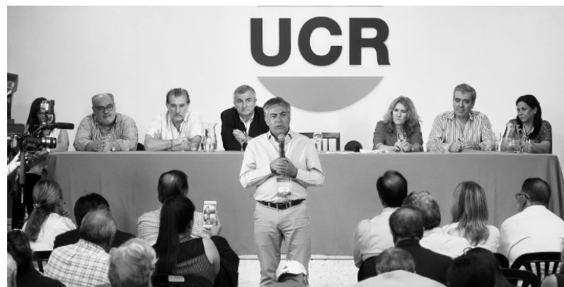
Los radicales debaten sobre el futuro de Cambiemos

Es cierto que el radicalismo hoy está partido en tres sectores: un núcleo, hoy minoritario, agrupado alrededor de Gerardo Morales (gobernador de Jujuy) y