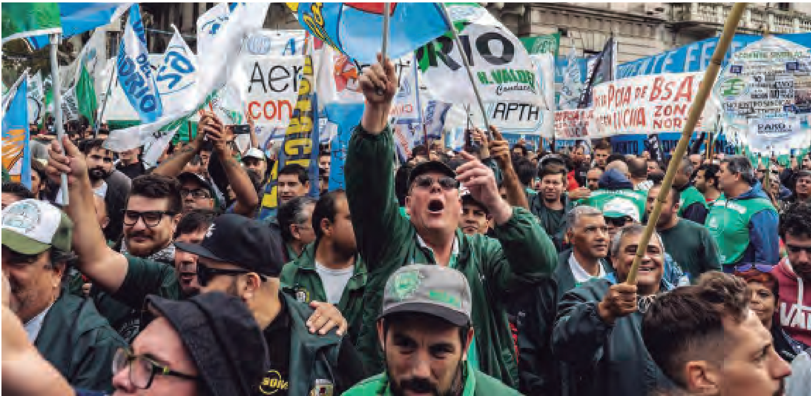
Sobran motivos para parar y reclamar la continuidad con un plan de acción

Por todo esto llamamos a parar masivamente, a la vez que exigimos la continuidad con nuevo paro de 36 horas con movilización y un plan de lucha nacional. Tenemos que realizar asambleas en todos los lugares de trabajo que se pueda, sacar pronunciamientos de cuerpos de delegados