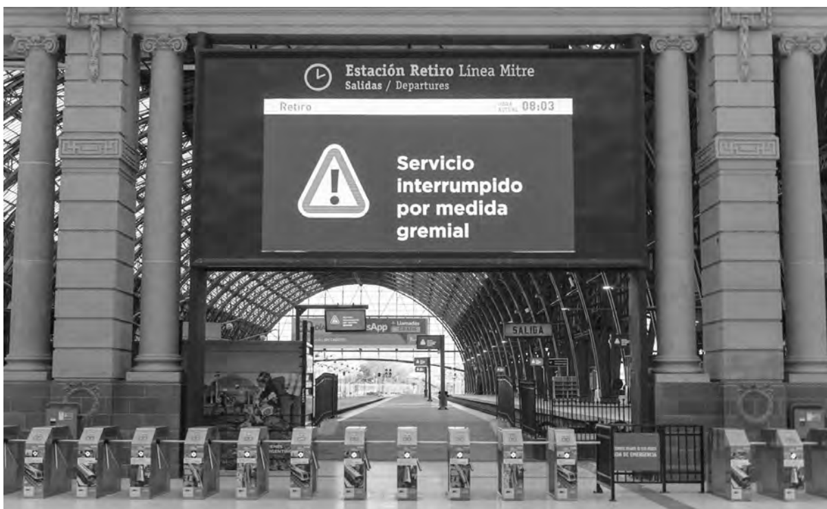
Contundente medida de fuerza que mostró la bronca de los trabajadores y sectores populares

Escribe Edgardo Reynoso Cuerpo de delegados del ferrocarril Sarmiento