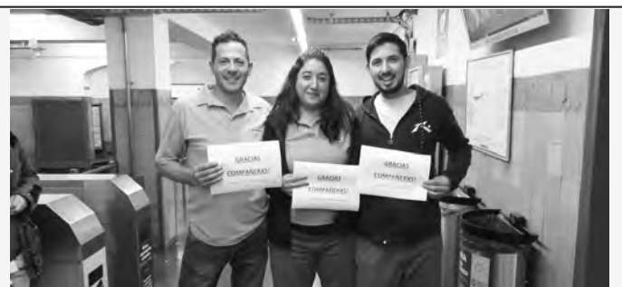
Miembros de la lista ganadora agradeciendo a sus compañeros