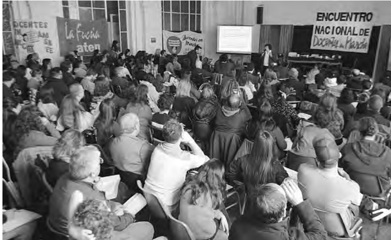
Cientos de docentes participaron y debatieron en comisiones y plenarios

El sábado 25 y domingo 26 de mayo realizamos en el IES "Alicia Moureau de Justo" de CABA nuestro Encuentro Nacional 2019. Delegaciones de CABA, Buenos Aires, Córdoba, Santa Fe, Neuquén, Chubut, Santa Cruz, Santiago y el NOA durante dos días debatimos profundamente en plenarias, comisiones y paneles y tomamos resoluciones sobre los principales temas que cruzan la vida política, sindical, educativa e ideológica de la docencia, espacio que solo nuestra agrupación realiza anualmente.