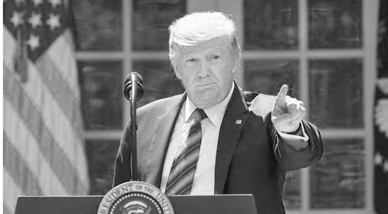
Trump agrade a Irán para privilegiar sus intereses imperialistas

Las tensiones entre Estados Unidos e Irán se profundizan con la ruptura del Plan de Acción Integral Conjunta (PAIC), acuerdo que concretó en 2015 Obama con el gobierno de Hassan Rohani con la garantía de la participación de otros países (Alemania, Francia, Rusia, China, etc). Irán aceptaba disminuir la producción de uranio enriquecido y Estados Unidos levantaría las sanciones.