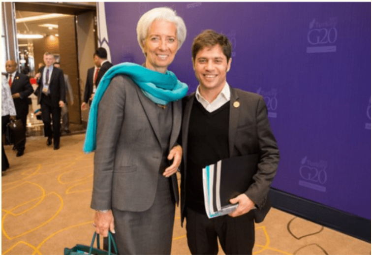
Lagarde del FMI recibió a Kicillof en una de sus giras