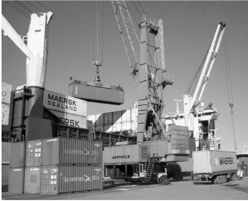
Las multinacionales son dueñas de puertos por donde salen productos sin control alguno

Todos sabemos que la Argentina es un país rico. Produce alimentos para 400 millones de personas. Tiene gas, petróleo y varios minerales estratégicos. Sin embargo, aumentan la pobreza, los bajos salarios y el desempleo. Vamos de crisis en crisis. ¿Por qué? La respuesta es una sola: somos una semicolonía capitalista del imperialismo.