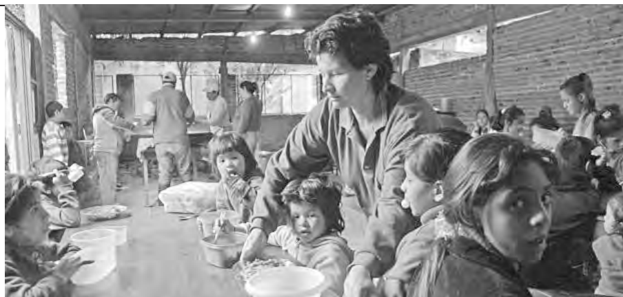
Cada día más familias tienen que recurrir a los comedores populares

Se acaban de conocer los datos oficiales del Indec que registran los parámetros de fines del primer semestre de este año: la pobreza creció a 27,3%, incrementándose con respecto al 25,7 de idéntico período del año anterior. Se trata de 11.800.000 personas en esa condición, de las cuales 800.000 cayeron en el último año. Los grandes núcleos urbanos, donde se concentra la mayor parte de la clase trabajadora, tuvieron números por encima de la media. Así en el Gran Buenos Aires la pobreza llegó a 31,9% y en el Gran Córdoba a 30,3%. Provincias históricamente pobres, como Santiago del Estero, siguen estando primeras, pero con un agravamiento de su situación: el 44,7% de los santiagueños, uno de cada dos, está en esa situación. Y todos estos números son los