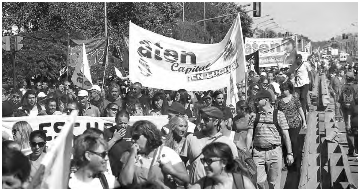
Una de las multitudinarias marchas de ATEN Capital durante los 43 días de paro

Tras la histórica huelga de 43 días que terminó con un triunfo conquistando la actualización automática del básico salarial según la inflación, además del no descuento de los días y una cifra fija, ahora llegó el turno de elegir a los dirigentes. Las elecciones se darán en el marco político signado por el ajuste de Macri apoyado especialmente por el gobernador Omar Gutiérrez, del MPN, y duramente enfrentados por las y los trabajadores, que soportan despidos, inflación imparable y subas continuas de la canasta familiar. Para la Multicolor, que reúne a la dirigencia actual de las seccionales más importantes de la provincia como lo son ATEN Capital, Plottier, Cutral-Có, y Zapala, se abre el desafío de desbancar a la conducción provincial del TEP, kirchnerista, encabezada por Marcelo Guagliardo, actual secretario general que va por la reelección y es actualmente integrante de la junta ejecutiva de Ctera.