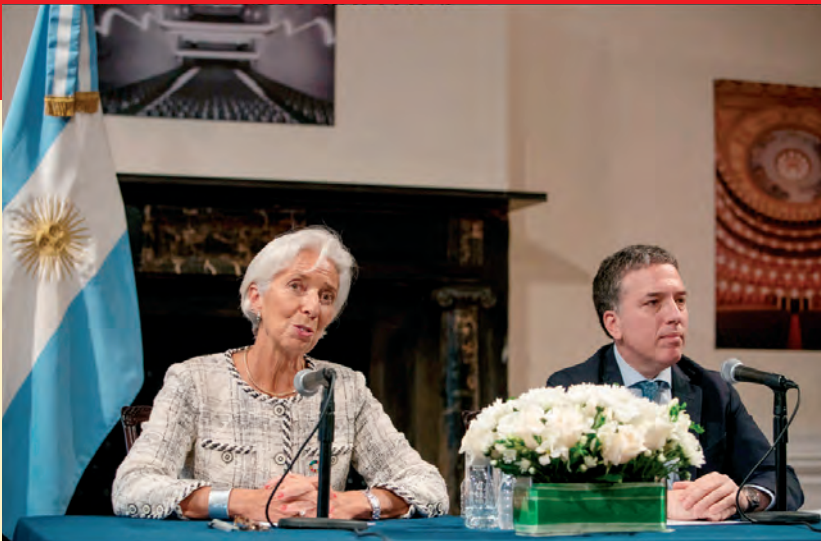
¡Indignante! Lagarde, del FMI, junto al ministro Dujovne en el consulado argentino en Nueva York. Nos quiere hacer creer que el acuerdo es “para proteger a los más vulnerables”

pueblo a enfrentar este nuevo pacto de ajuste de Macri, el FMI y los gobernadores exigiendo el nuevo paro de 48 horas para derrotarlo ahora y no esperar a 2019 como plantea el peronismo, incluido el kirchnerismo.