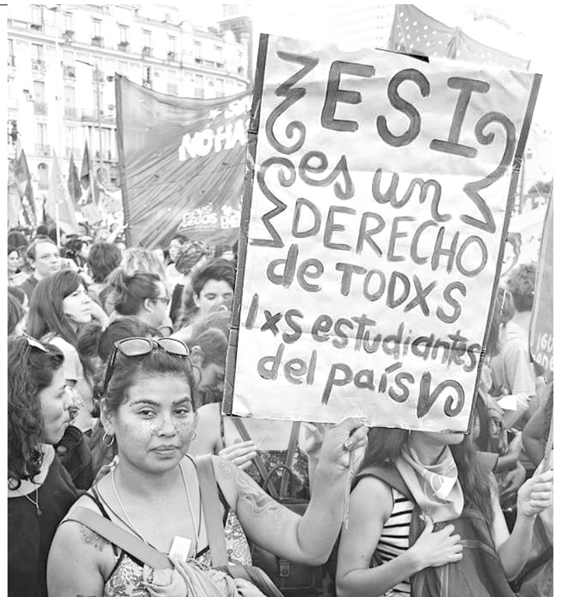
Después de doce años las mujeres siguen exigiendo que se cumpla la ESI

Desde Isadora e Izquierda Socialista, como parte de la Campaña Nacional por el Derecho al Aborto seguimos exigiendo educación sexual para decidir, anticonceptivos para no abortar y aborto legal para no morir. ¡Inmediata separación de la Iglesia del Estado! Y ¡Basta de subsidiar a la Iglesia Católica!