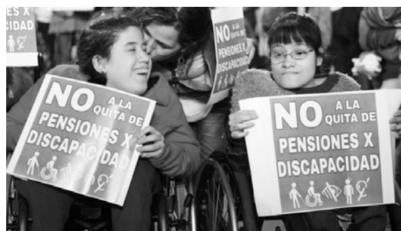
Movilización exigiendo que no se eliminen las pensiones

Desde que asumió el actual gobierno de Macri, más de 170.000 pensiones fueron dadas de baja compulsivamente. Usando distintos argumentos, entre ellos un supuesto “abuso” en sus otorgamientos, el gobierno busca hacer bien los deberes que le pide el FMI y nuevamente mete la mano en los sectores más vulnerables. Luego de endurecer el régimen y las exigencias para tramitar no sólo una pensión, sino un certificado de discapacidad, una nueva resolución publicada en el Boletín Oficial obliga a los beneficiarios a revalidar sus pensiones en la Anses, haciendo frente a una extensa lista de requisitos y trabas burocráticas. Rechazamos cualquier intento de seguir ajustando a los trabajadores y sectores populares, en este caso quitando las pensiones a personas en situación de vulnerabilidad, con necesidades especiales, imposterables y de urgente atención.