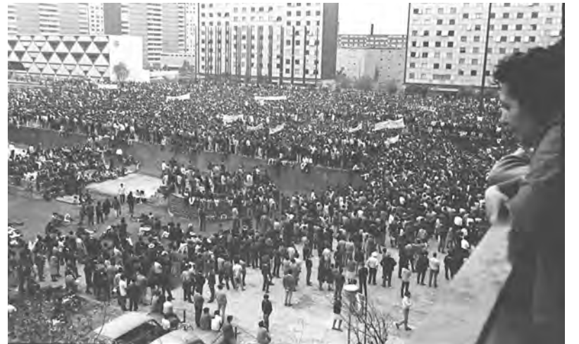
Marcha de estudiantes antes de la represión en la Plaza de las Tres Culturas en Tlatelolco

sacrados más de 300 estudiantes, hubo miles de heridos y unos 3.000 manifestantes fueron detenidos, desnudados, golpeados y trasladados a distintas cárceles o campos militares, como el Palacio Negro de Lecumberri. La plaza se lavó a manguerazos para borrar las huellas de la masacre mientras el ejército imponía la censura informativa y el gobierno difundía la falsa noticia de un "complot comunista" contra las olimpiadas. La represión no cesó y muchos dirigentes fueron forzados al exilio. Unos días después, como si nada hubiera sucedido, comenzaban las Olimpiadas México '68.