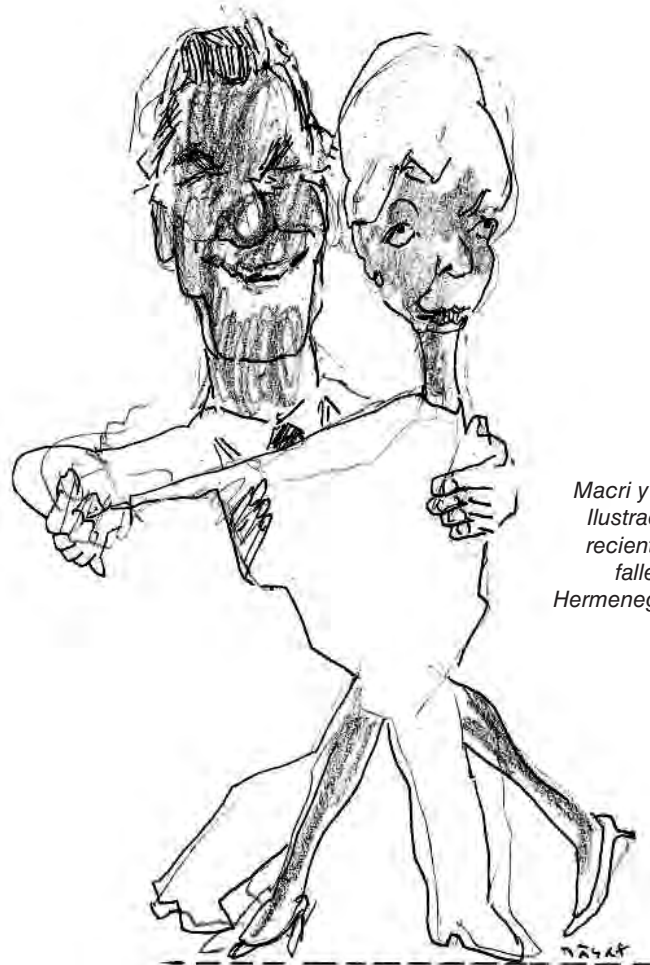
Macri y Lagarde. Ilustración del recientemente fallecido Hermenegildo Sábat

El gobierno de Cambiemos se muestra más claramente que nunca como lo que es: el gobierno de los ricos, agente directo del imperialismo yanqui y de los buitres acreedores internacionales. Todo su programa económico, ahora más que nunca con el nuevo plan de ajuste acordado con el FMI, está al servicio de las ganancias de estos sectores. Las consecuencias para el pueblo