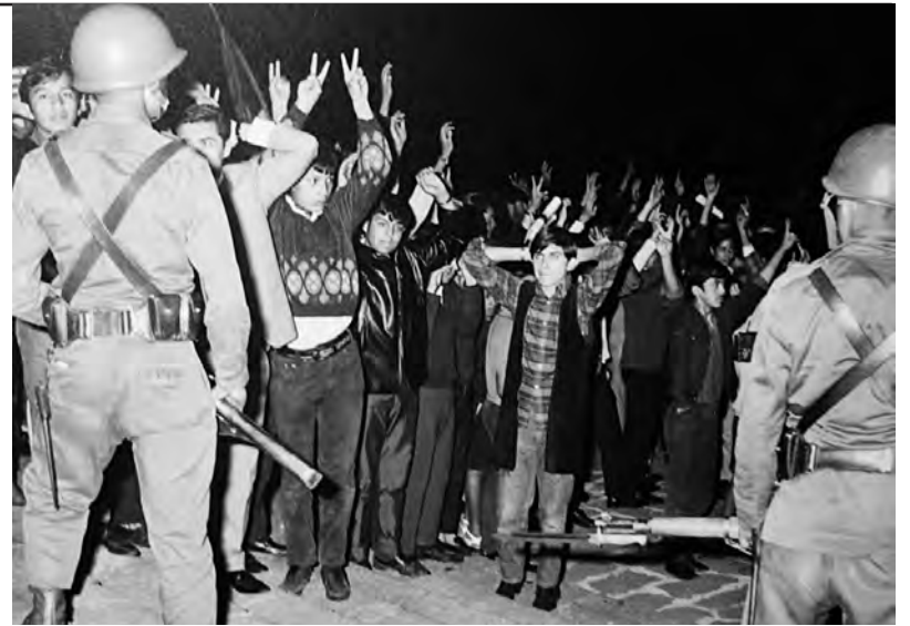
Estudiantes detenidos tras la masacre

"¡Contra la pared hijos de la chingada! ¡Ahorita les vamos a dar su revolución!", fue la frase histórica que pronunciaron los mandos del ejército mexicano al detener a los dirigentes estudiantiles. En el curso de la operación fueron ma-