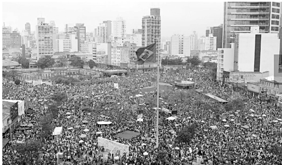
Se dieron multitudinarias marchas de mujeres repudiando a Bolsonaro en más 300 ciudades de Brasil