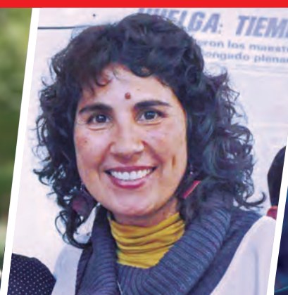
ANGÉLICA LAGUNAS DIPUTADA DE NEUQUÉN Y DIRIGENTE DOCENTE