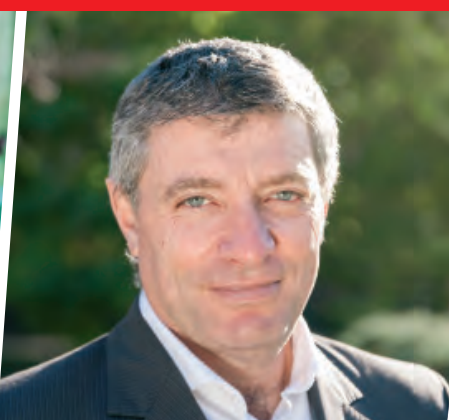
JUAN CARLOS GIORDANO DIPUTADO NACIONAL ELECTO