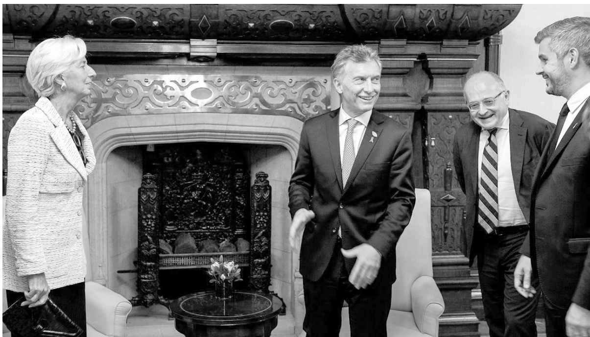
Christine Lagarde, del FMI, felicitó a Macri por la aplicación de su receta de ajuste

Es evidente que con estos números no hay “bono” que alcance para recomponer nada. Sumémosle los 70.000 puestos de trabajo que se perdieron en 2018, de los cuales 42.200 son fabriles (y 30.000 solo en septiembre) y tenemos el combo completo: terminaremos un año con