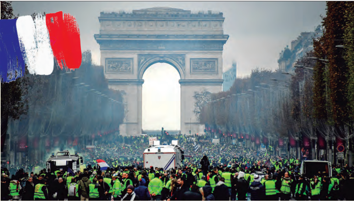
Multitudinarias movilizaciones contra las políticas de Macron