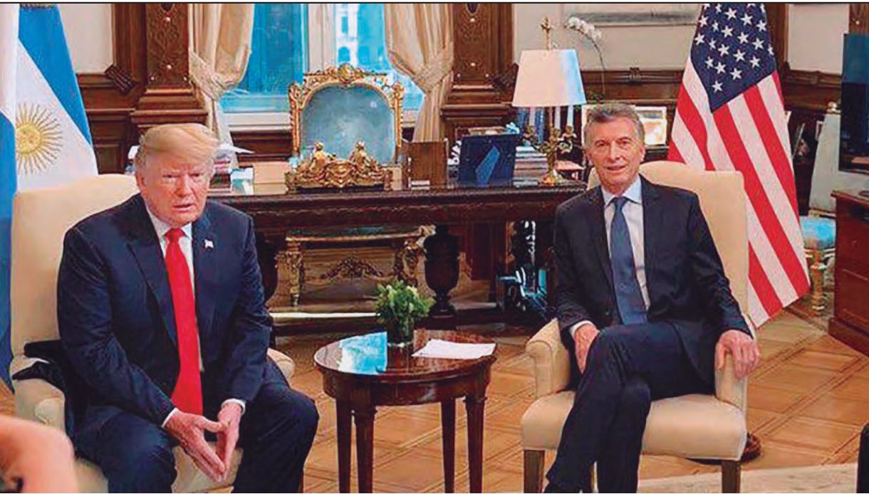
Trump en la reunión con Macri en la Casa Rosada

La no superación de la crisis económica capitalista abierta en 2007 lleva a choques interburgueses por sus negocios. La disputa comercial de Estados Unidos-China es parte de esa pelea por el reparto de la “torta” que