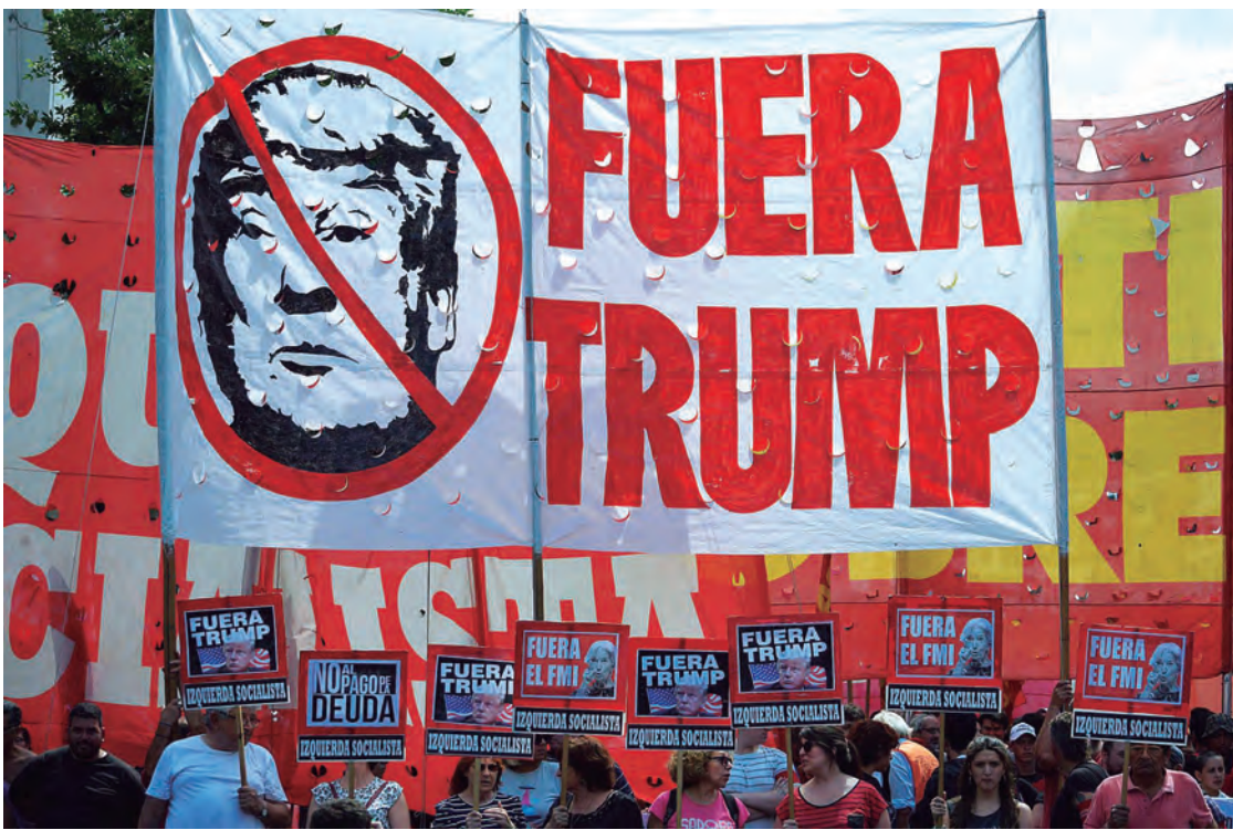
Decenas de miles se movilizaron contra Trump y demás líderes imperialistas del G20

Previamente a la marcha, el Frente de Izquierda realizó un acto en el que se leyó un documento elaborado en conjunto por los tres partidos, en el que se señalaba “los mandatarios que concurren a Argentina (Trump, Merkel, Macron, May, Putin, Erdogan y otros) son los responsables de las masacres y bombardeos contra los pueblos de Siria, Libia, Irak, Palestina, Yemen, kurdos, entre otros [...]