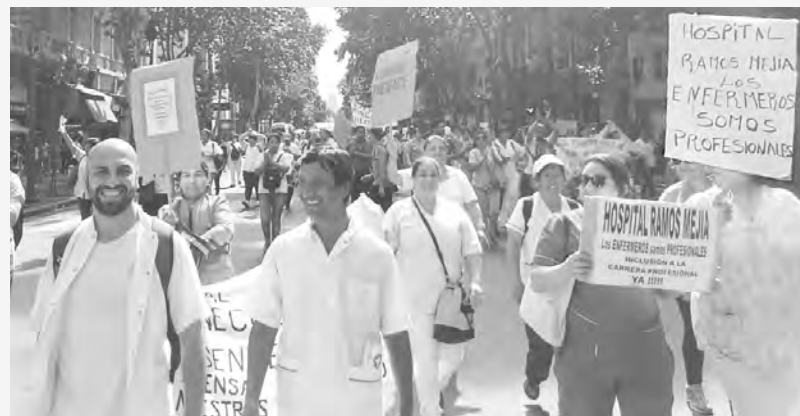
La marea blanca empieza a organizarse

La gran rebelión espontánea de la enfermería porteña desbordó a la dirigencia sindical de Sutecha, el sindicato mayoritario, y a otros como UPCN y ATE, generando un vacío de dirección que empezó a ser llenado en las distintas reuniones de coordinación realizadas en las últimas semanas. En la última se votó la siguiente resolución: “Constituir una coordinadora genuina conformada por dos representantes de cada hospital público, privado, escuelas y universidades y asociaciones con voz y voto y la participación con voz y sin voto de los sindicatos que apoyen”. Categóricamente, se abrió la posibilidad de construcción de una coordinadora que pueda convertirse en una nueva