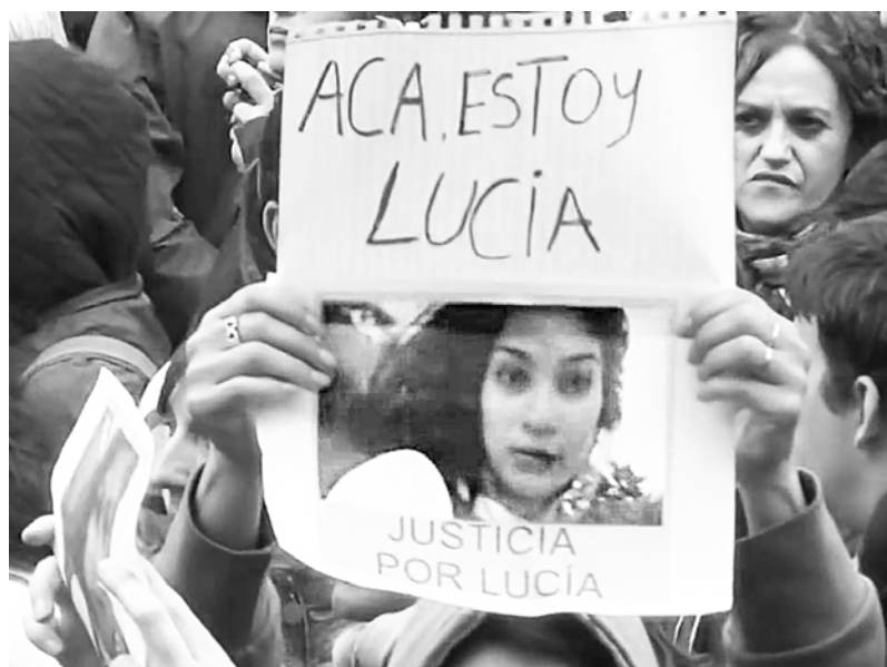
Avanza el repudio contra el fallo misógino