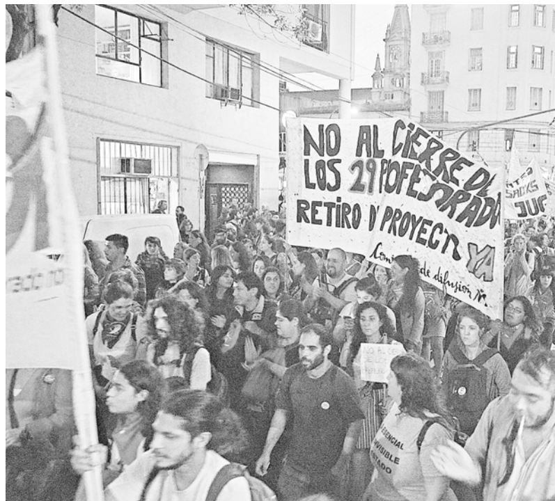
La lucha continuará contra la implementación de la ley

El gobierno se volverá a equivocar si supone que la aprobación de la ley cierra el conflicto en el nivel terciario. Dimos pelea hasta el último minuto para evitar la aprobación, no aceptando ninguna “derrota digna” como quería imponer la burocracia sindical. Ahora se abre la lucha para impedir la implementación de la ley y evitar que la Unicaba se ponga en funcionamiento en 2020. Es necesario seguir coordinando entre todos los sectores para continuar dando de manera unitaria y consecuente esta pelea, generando mecanismos asamblearios abiertos para derrotar el proyecto del gobierno. La desconcentración del mismo 22 fue con una importante marcha de miles de estudiantes y docentes, que llegó a la sede de la Dirección de Educación Superior. Esa marcha final demostró que el movimiento de lucha sigue en pie y dispuesto a dar la pelea durante el próximo año. Incluso sectores estudiantiles, acompañados por la Juventud de Izquierda Socialista, desbordaron a la conducción kirchnerista de la CET y fueron a realizar