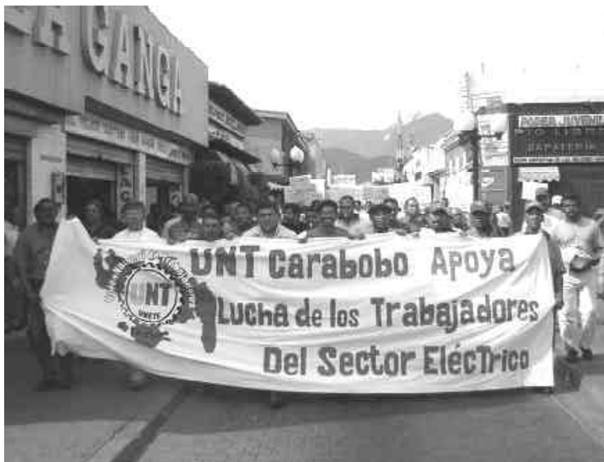
Marcha obrera de la UNT en apoyo a la cogestión del sector eléctrico

Seguidamente Chirino expresa: “Tenemos una confianza muy grande, no porque seamos más inteligentes, porque tengamos mejores recursos de oratoria, mejores relaciones políticas con los factores de poder o porque tengamos un “aparato” con el cual los podamos aplastar. La confianza nuestra es muy sencilla, apostamos con los ojos cerrados al proceso de rebelión antiburocrática que se opera en el movimiento sindical...es “una revolución en el movimiento sindical... La burocracia sindical que llegue a la UNT va a salir apaleada por las bases. La gente no soporta imposiciones, ni quiere supuestos dirigentes que trafiquen con sus derechos, que se vuelvan ricos de la noche a la mañana a nombre de sus intereses”. Y define a la democracia sindical plena, las asambleas generales, el permitir que opinen todos los compañeros, como “nuestra medicina” contra la burocracia.