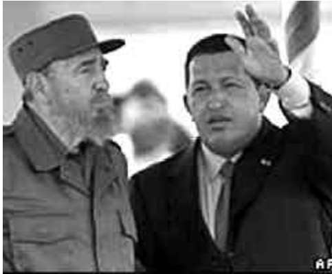
Fidel Castro y Hugo Chávez en La Habana

Hay 18.000 médicos, oftalmólogos y odontólogos cubanos en la llamada “Misión Barrio Adentro”, que llevó atención médica gratuita a los barrios populares, incluso a lugares que nunca antes tuvieron atención médica, y que atiende a 18 millones de personas. Viajaron 80.000 venezolanos a Cuba, sin pagar un centavo de su bolsillo, para curarse enfermedades. Cuba también ayudó en la alfabetización masiva.