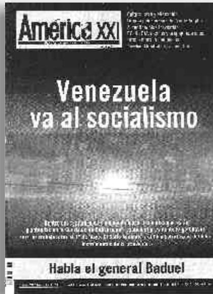
Portada de la revista América XXI

Es así como el camino al socialismo se traza expropiando a la burguesía explotadora, apoyándose en la movilización y la tremenda disposición de lucha del pueblo y los trabajadores. Es pasando al control de los trabajadores todas las industrias abandonadas o cerradas por los patronos, y propiciando el control obrero, la apertura de los libros de contabilidad y eliminando el secreto comercial en todas las empresas; simultáneamente con la expropiación de la banca usurera, y creando un banco nacional donde se concentren todos los recursos provenientes de la exportación de petróleo para ponerlos al servicio de un Plan Nacional de Obras Públicas