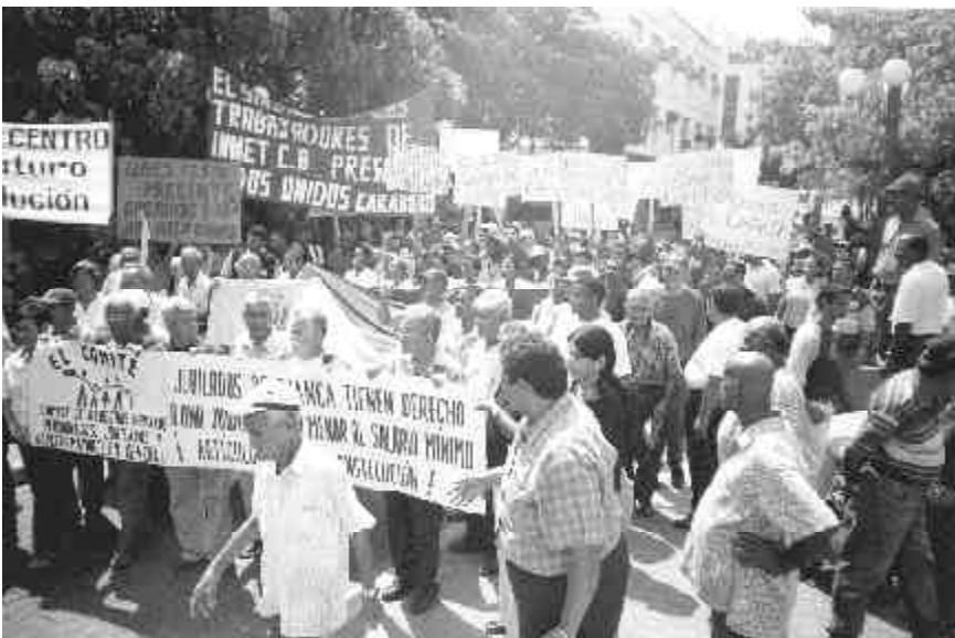
Movilización obrera y de jubilados en Puerto Cabello

Efectivamente, como dijera Chirino: “esta revolución no tiene destino sino construimos un partido revolucionario”.