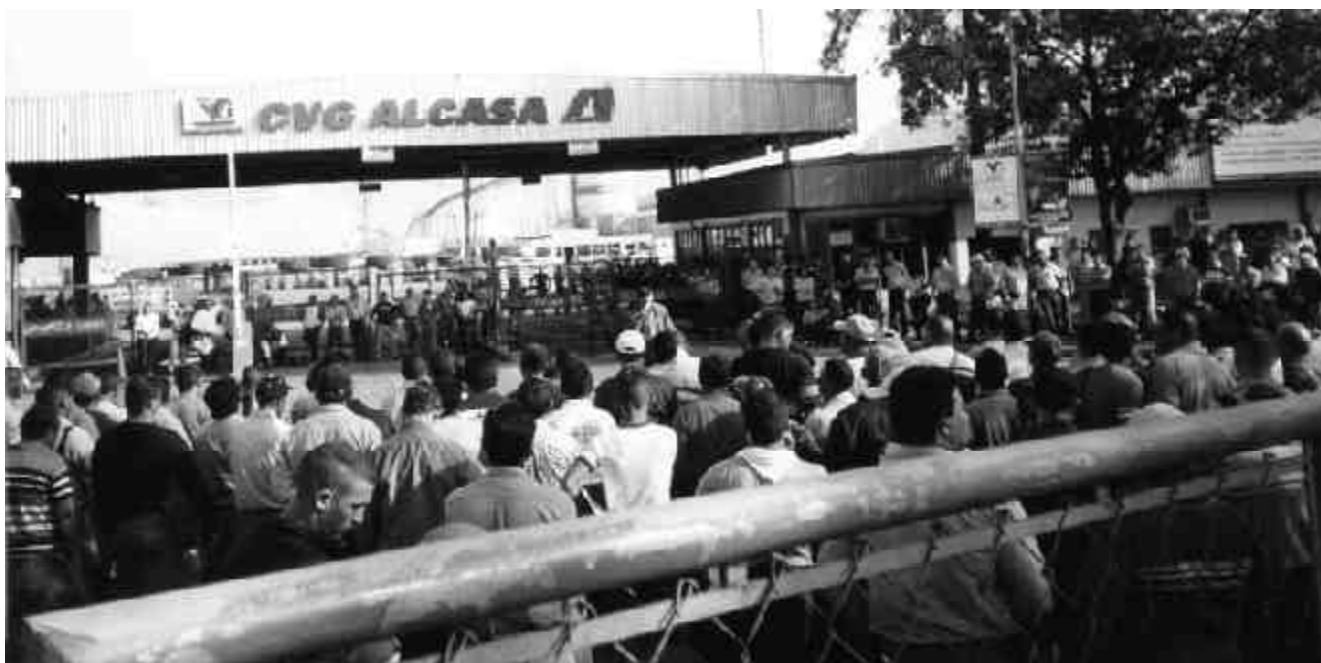
Asamblea en el portón de Alcasa, fábrica estatal de aluminio

que van mucho más allá de las palabras o los nombres. En un reciente reportaje, Orlando Chirino explica en forma sencilla y contundente su concepción sobre el control obrero y la cogestión como pasos concretos para la movilización y la democracia dentro de las empresas, contra el verticalismo y los burócratas. “En primer lugar, ambas se dan en el marco del capitalismo. Control obrero y cogestión, no son sinónimos de socialismo, son una etapa transitoria, de alta tensión, de alta confrontación entre el pueblo y los capitalistas. En segundo lugar, por decirlo de alguna manera, es el momento en que existen dos poderes dentro de las empresas, es lo que históricamente se ha denominado doble poder o dualidad de poder. Y así como se puede avanzar, también se puede retroceder. Todo depende de la política que se den los trabajadores. [...] En tercer lugar, es una experiencia que por ser altamente conflictiva no puede durar mucho en el tiempo. O bien porque los empresarios o los tecnoburócratas no soportan aceptar el control o «compartir» las empresas con los trabajadores, o bien porque los trabajadores también llegan a la conclusión de que sus intereses son contrarios a los de los empresarios y que para poder avanzar hay que expropiar, no sólo a esos, sino a todos los capitalistas y a partir de allí adelan-