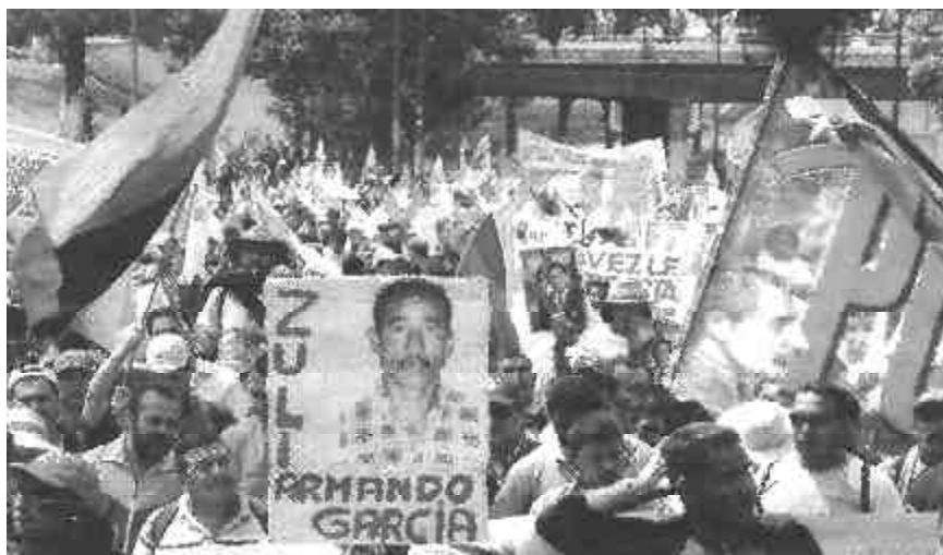
Marcha campesina en Caracas por la reforma agraria

Sin embargo, vemos con interés y entusiasmo que el pueblo y los trabajadores no se han dormido en los laureles, ni mucho menos se decepcionan. Por el contrario, continúan luchando por sus derechos y reivindicaciones. En los últimos meses comienzan a movilizarse y a salir a la calle de manera autónoma. Ya no están esperando que Chávez los convoque. Un titular de primera página del vespertino El Mundo , rezaba, en días pasados: “Chávez presionado por protestas del