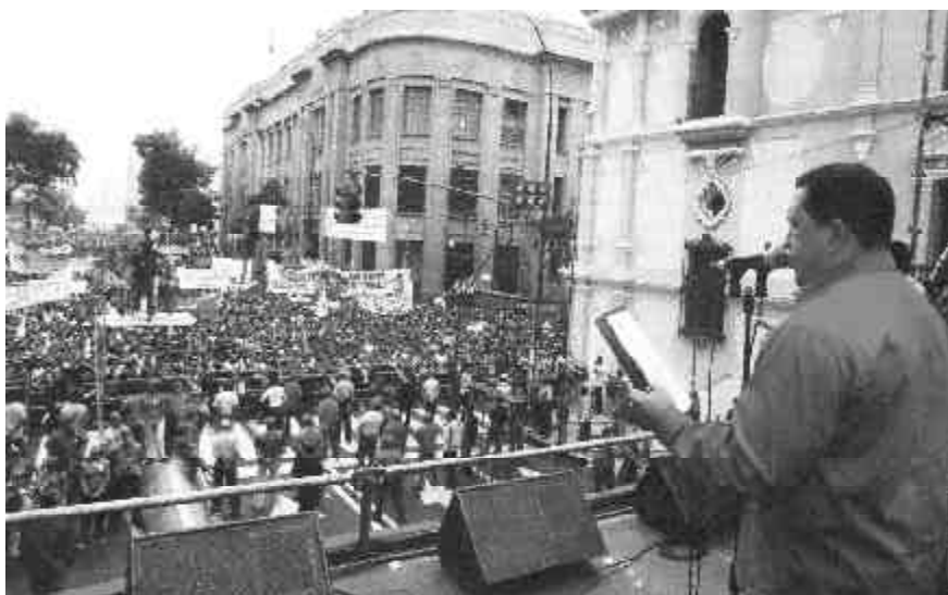
Chávez habla en el acto del 1º de mayo

Si bien el gobierno de Chávez tiene una postura antiimperialista y ha ejecutado algunas medidas de expropiación, estas son muy minoritarias y no han modificado las bases del dominio y explotación capitalis-