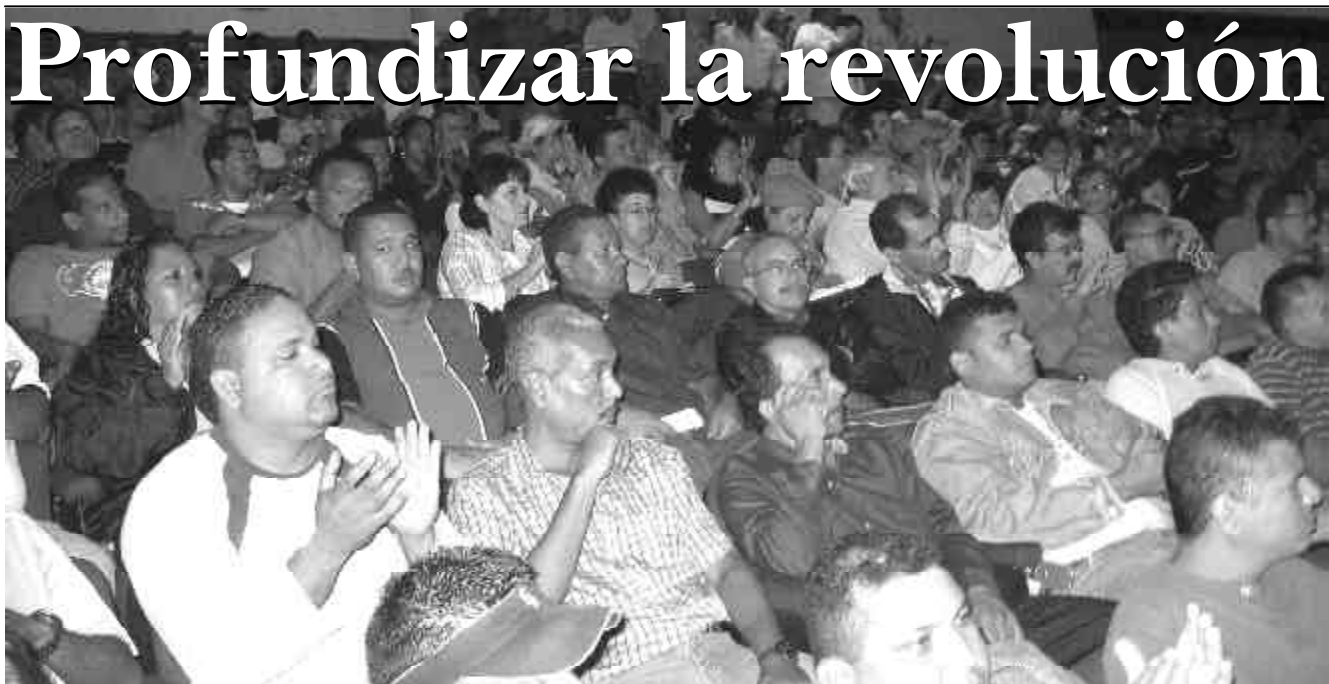
Acto de lanzamiento del PRS, en Caracas el 9 de julio de 2005.