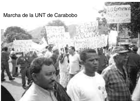
Marcha de la UNT de Carabobo

Un partido que luche por una nueva sociedad, libre de explotación y humillaciones, que luche por el socialismo con democracia.