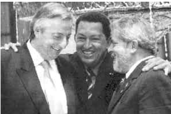
Kirchner, Chávez y Lula: coincidencias y diferencias

de la privatización total. Es lo opuesto de lo que hace en Argentina Kirchner, que sostiene la privatización de YPF en manos de la española Repsol. Respecto a la relación política directa con Bush, es evidente que Chávez tiene roces, que el propio imperialismo lo ha querido voltear a través de un golpe de Estado y luego hubo otro intento con un referéndum. Lula y Kirchner reciben felicitaciones y la bendición de Bush y el Fondo Monetario por cumplir las metas que éstos le fijan.