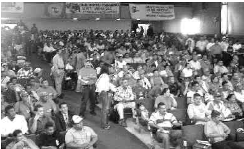
Una vista del Plenario obrero.

ca patronal a favor del consorcio Amazonia y los empresarios de Sidor en contra de los trabajadores. Y finalmente informó sobre la realización de un acuerdo unitario de los sectores luchadores, para presentar una plancha común contra la el clan burocrático de Machuca.