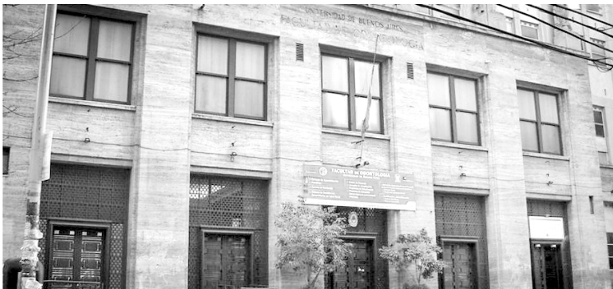
Las clases siguen virtuales sin garantizar la conectividad a estudiantes y docentes

Ante esta realidad, las conducciones burocráticas de las federaciones y los centros de estudiantes le hacen seguidismo a las autoridades y al gobierno, no convocan a la