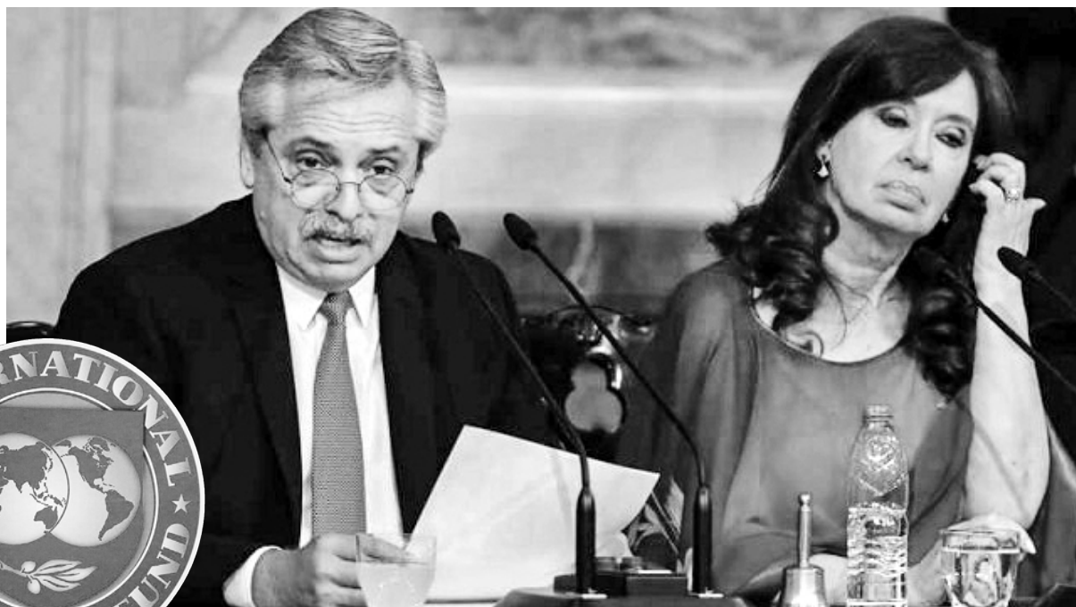
Alberto y Cristina, unidos en pagarle al FMI

No hay que confundirse. Más allá de discursos y poses electorales, la política del gobierno peronista del Frente de Todos no tiene nada de “progresista” o “nacional y popular”. Su prioridad es negociar con el FMI y garantizar el cumplimiento de los pagos a los pulpos acreedores internacionales.