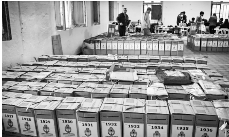
El gobierno y la oposición patronal debaten prorrogar las PASO

En Juntos por el Cambio la reunión profundizó su interna. Bullrich, presidenta de PRO, rechazó de plano la propuesta de cualquier modificación. Cornejo, presidente de la UCR, y los gobernadores de las provincias acuerdan no apresurar definición alguna en tiempos don-