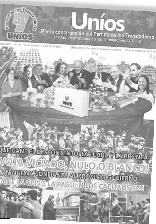
Tapa del periódico de Uníos

y ser, desde una perspectiva regulacionista, el bombero que pueda apagar el incendio de la inestabilidad política y un nuevo estallido social. Es por eso que Verónica Mendoza hace méritos y gestos para ponerse a disposición de los empresarios de la inversión privada con un tibio llamado a referendo por una nueva Constitución. Cuando Mendoza gira al centro, también lo hace Marco Arana, que se reúne con la Sociedad Nacional de Industria para ordenar su plan de gobierno y decirles a los empresarios “no voy a chocar con ustedes”.