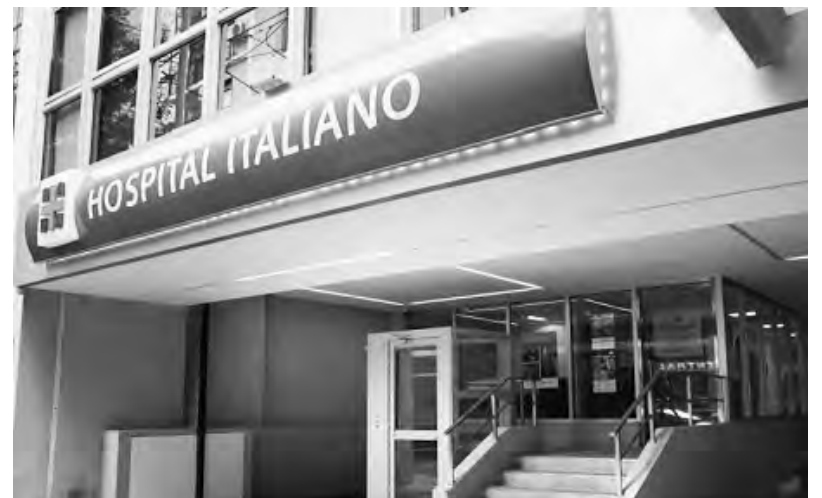
Cambiemos pretende que la salud privada venda las vacunas

Es parte de lo que hicieron en CABA. El gobierno de Rodríguez Larreta entregó un lote de vacunas para que las prepagas se las apliquen a “sus clientes”. De esta forma, el Hospital Alemán y el Sanatorio Güemes promocionan a través de sus páginas oficiales vacunas exclusivas para los abonados de sus planes médicos con la intención de atraer más socios. Es el sofisticado sistema de “vacunatorio vip” de Larreta. De esta forma los adultos mayores no tienen los mismos derechos para vacunarse. Habrá un grupo de primera clase, que son los socios de las prepagas, como ellos promocionan, que se