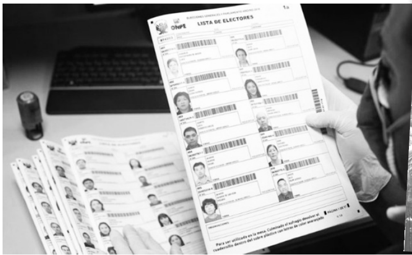
Boleta única: ningún candidato despierta entusiasmo popular

¡El voto nulo es un voto digno ante la podredumbre del sistema! ¡No les regales tu voto a los ajustadores ni a la falsa izquierda! ¡Votá nulo para defender las luchas en curso! ¡Votá nulo o en blanco para que la crisis la paguen los capitalistas!