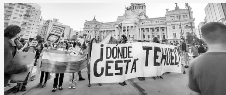
Marcha frente al Congreso nacional

En la provincia de Buenos Aires existe una ley de cupo laboral travesti-trans desde 2015 que no se aplica en su totalidad. La norma establece que, mínimo, 1% de los puestos de trabajo en el sector público debe ser ocupado por personas travestis o trans, pero en realidad son escasos los municipios bonaerenses que han adherido: San Isidro, Quilmes, Avellaneda, Lanús, Morón, Almirante Brown, Merlo, Tres de Febrero, San Miguel, San Martín, Chivilcoy, Azul y Mar del Plata, según el relevamiento realizado por Economía Femeni(s)ta al 25/5/2018, denominado "Mapa del cupo laboral trans".