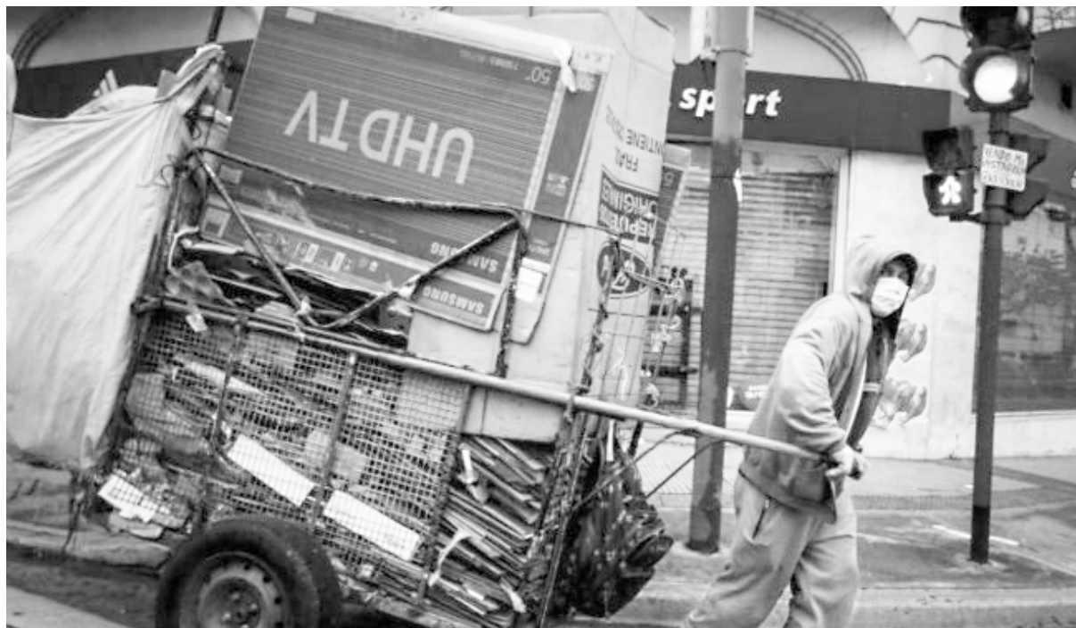
Por las políticas de ajuste cada vez más pobreza y marginación

Los pobres son cada vez más pobres. La brecha entre los ingresos de los pobres y el valor de la canasta básica de bienes y servicios que necesita una familia tipo para vivir aumentó en el último año de 35,5% a