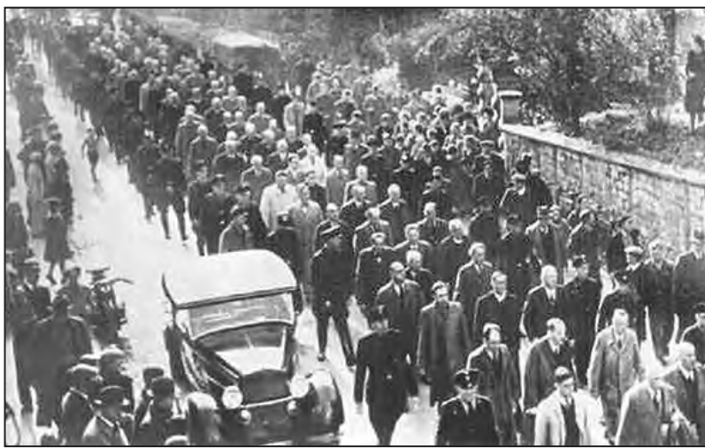
Guardias de las SS arrestaron judíos en la noche de los cristales

En 1923, el 8 de noviembre, hicieron un fracasado intento de golpe que se inició en una cervecería en Munich. Hitler fue preso. Aprovechó la reclusión para escribir su célebre texto Mi lucha . Diez años después logró adueñarse del poder e iniciar la monstruosa dictadura del Tercer Reich.