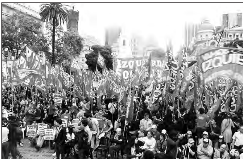
Contra los políticos patronales el FIT es alternativa

Del otro lado, los PJ anti-K, PRO, UCR y UNEN, son una bolsa de gatos. Massa apoya a los radicales