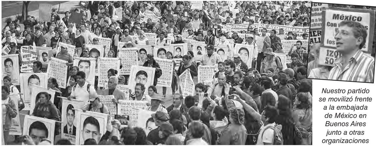
Miles de mexicanos ganan las calles contra la impunidad

grado, que obligaron al gobernador Aguirre Rivero, del PRD (Partido de la Revolución Democrática), a renunciar a regañadientes, pues venía siendo apoyado incondicionalmente por su partido a nivel nacional, en un acto vergonzoso que lo ha mostrado tal cual es, un partido corrupto al que sólo le preocupa mantener sus cuotas de poder, por encima inclusive de un hecho tan abominable. El costo político de esa postura será seguramente demoledor.