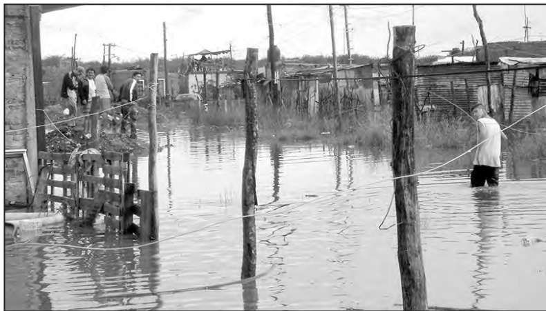
Un barrio inundado de La Matanza. El gobierno es responsable

Otra vez, como en Tartagal, Santa Fe o La Plata, el pueblo trabajador sufre muertos y enormes pérdidas materiales, con barrios anegados y sin electricidad. Esta catástrofe social nada tiene de "natural". Sus responsables son los gobiernos de Cristina Kirchner, Scioli y los intendentes. Tras más de diez años del llamado "modelo k", la infraestructura social, habitacional y sanitaria del país está en ruinas. Los recursos necesarios para las obras son desviados a los privatizadores, banqueros y grandes capitalistas, a expensas de la vida de los trabajadores y el pueblo pobre. Estos gobiernos rescatan con fondos