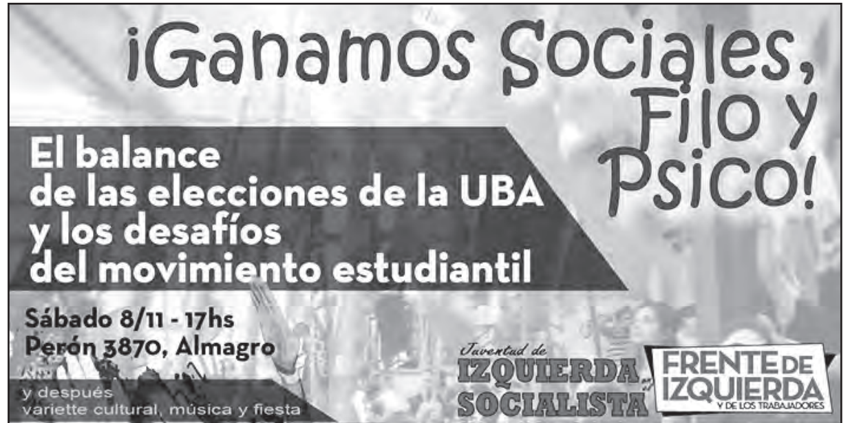
La Juventud de Izquierda Socialista realizará un plenario abierto para debatir sobre las conclusiones y los desafíos que dejaron las elecciones de la UBA

En Psicología también ganamos con La Izquierda al Frente con el