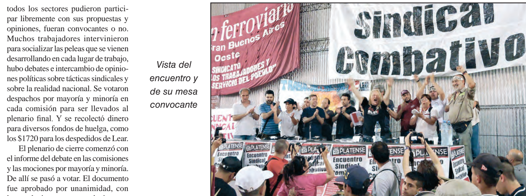
Vista del encuentro y de su mesa convocante

todos los sectores pudieron participar libremente con sus propuestas y opiniones, fueran convocantes o no. Muchos trabajadores intervinieron para socializar las peleas que se vienen desarrollando en cada lugar de trabajo, hubo debates e intercambio de opiniones políticas sobre tácticas sindicales y sobre la realidad nacional. Se votaron despachos por mayoría y minoría en cada comisión para ser llevados al plenario final. Y se recolectó dinero para diversos fondos de huelga, como los $1720 para los despedidos de Lear.