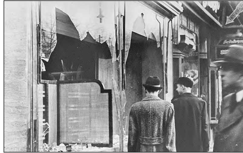
Uno de los tantos negocios judíos destruidos

Entre el 9 y 10 de noviembre, en toda Alemania, grupos de choque directamente alentados por Goebbels llevaron a cabo un gigantesco pogrom 1 , protegidos por las