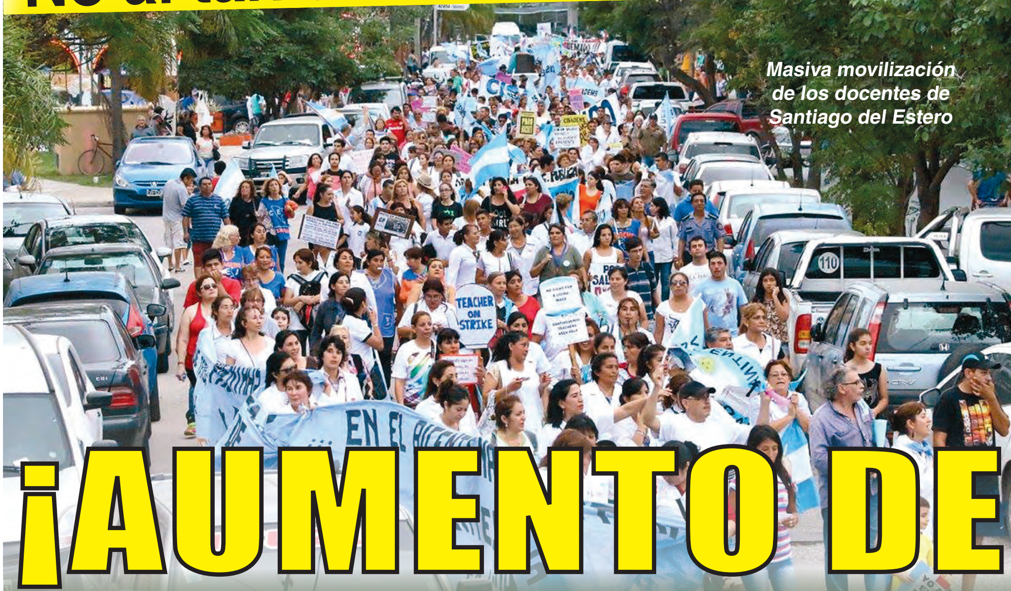
Masiva movilización de los docentes de Santiago del Estero