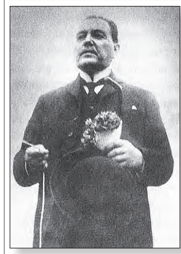
Yrigoyen jugaba al misterio y cultivaba una imagen de "santón laico"

verdadera carnicería humana conocida como la "Gran Guerra" o "Primera Guerra Mundial". Y la lucha contra esa guerra criminal engendraría revoluciones en varios países -como Alemania, Italia y Hungría, derrotadas- y la toma del poder en Rusia por parte de los trabajadores y el Partido Bolchevique en 1917. Entró en crisis también -momentáneamente- la bonanza de la oligarquía y de allí también que, en la lejana Argentina, los trabajadores buscaran otros caminos que el electoral para hacer oír sus reclamos y las luchas obreras crecieran año a año.