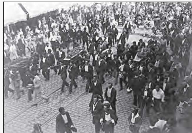
Funeral de obreros asesinados en la Semana Trágica