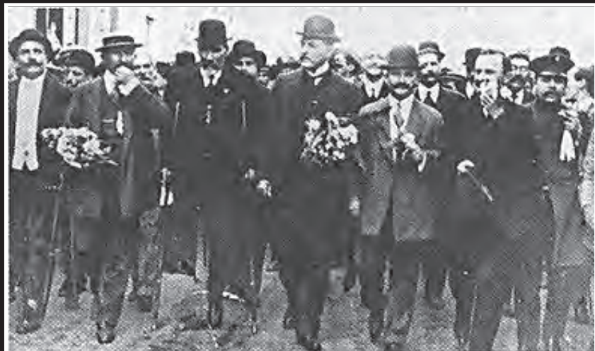
Hipólito Yrigoyen, acompañado por periodistas, camino a asumir el gobierno

Se cumplen cien años del primer gobierno elegido "democráticamente". Desde un punto de vista, la Argentina cambió. Sin embargo para los trabajadores fueron años de represión salvaje.